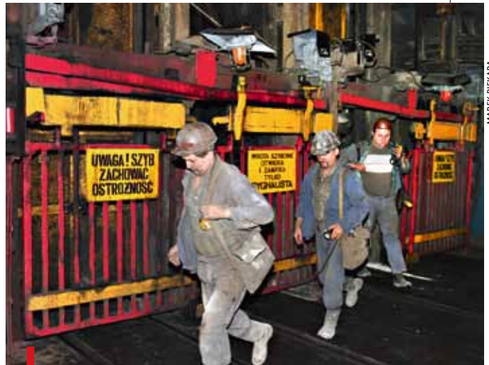
Górnicy domagają się m.in. 10-procentowej podwyżki płac