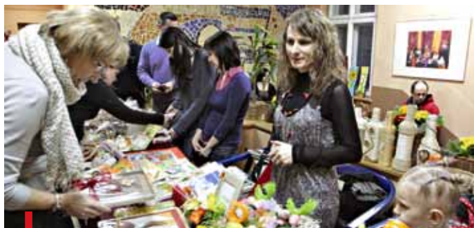
Dużym zainteresowaniem cieszył się kiermasz przedmiotów wykonanych przez podopiecznych pszczyńskiego ośrodka

spotkanie pod hasłem „Ole naszych serc” w Pszczyńskim Centrum Kultury 3 marca zorganizowali pracow-