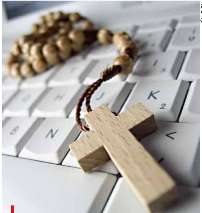
Dobre postanowienie wielkopostne – modlitwa zamiast wielu godzin przy komputerze