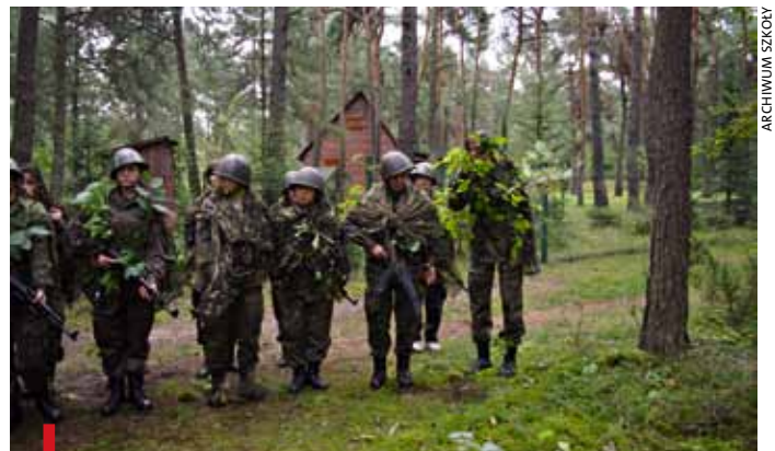
Klasa wojskowa z XV LO w Katowicach podczas obozu w Śiamoszykach na Jurze Krakowsko-Częstochowskiej

Przy realizacji zajęć sprawnościowych szkoła liczy na współ-