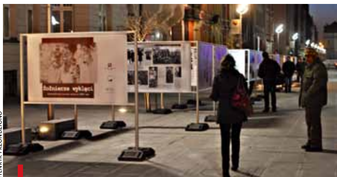
Przed kościołem pw. Wniebowzięcia Najświętszej Maryi Panny w Katowicach otwarto wystawę pt. „Żołnierze wyklęci”

KATOWICE. Uroczyste obchody Narodowego Dnia Pamięci Żołnierzy Wyklętych miały miejsce 1 marca m.in. w Śląskim Urzędzie Wojewódzkim i w kościele Mariackim. To nowe święto państwowe