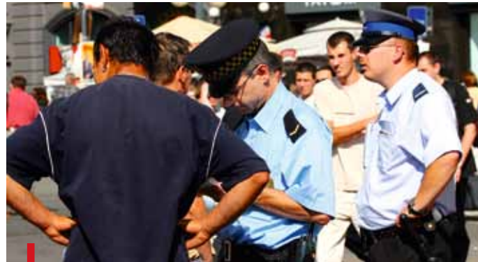
Za przekroczenie dozwolonej prędkości strażnik może teraz ukarać mandatem

Wydaje się, że rozszerzenie wachlarza kompetencji Straży Miejskiej ułatwi jej funkcjonowanie. Wprowadzone zmiany w wielu przypadkach skrócą procedury