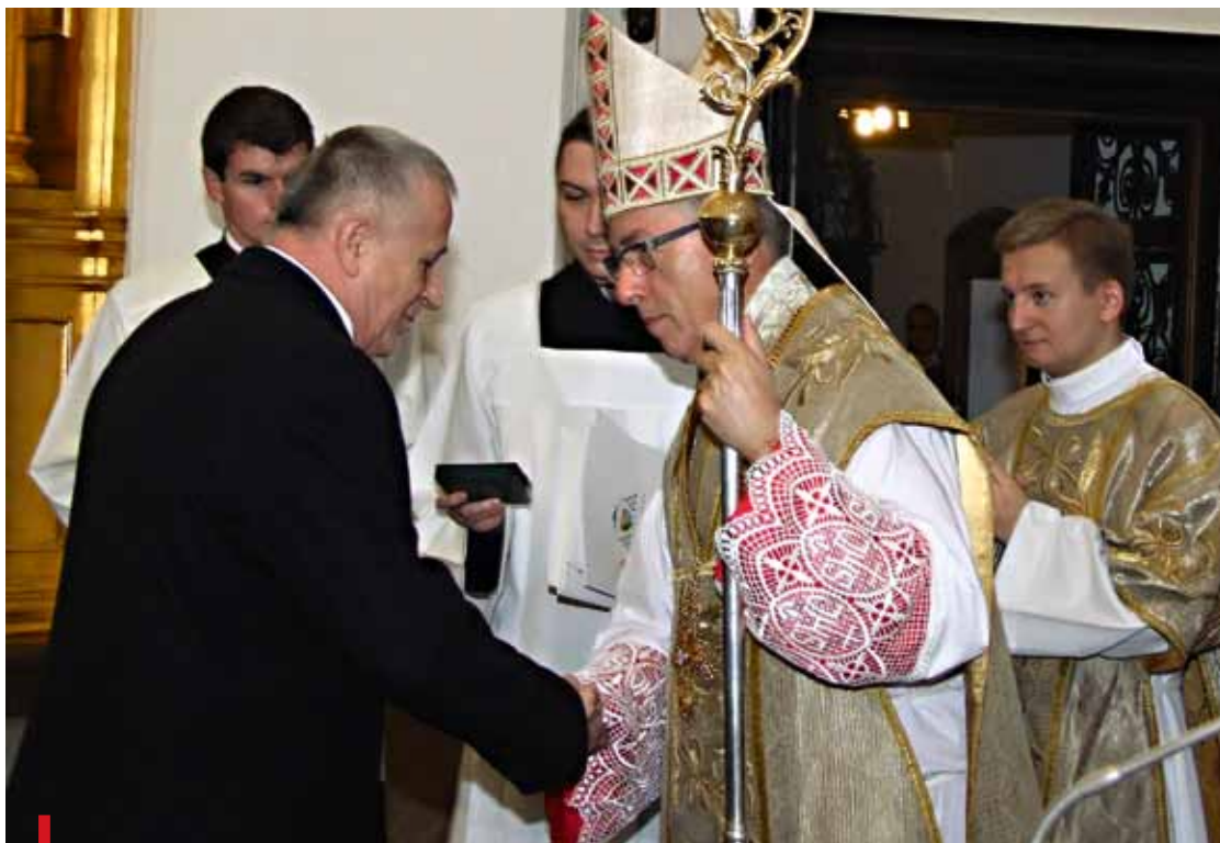
W tym roku dziewięć osób uhonorowano medalem Dei Regno Servire

Za czasów zaborów Katolickie Stowarzyszenie Młodzieży było częścią Akcji Katolickiej. Dziś to dwa odrębne stowarzyszenia, razem jednak obchodzą swe święto patronalne i oddają cześć Królowi Wszechświata.