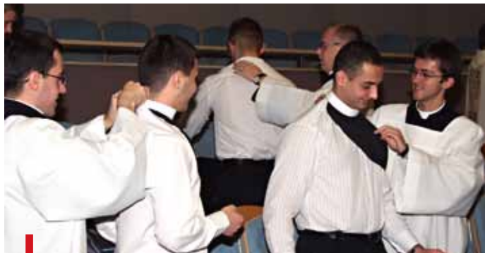
Obłóczyny to kolejny krok na drodze do kapłaństwa – podkreślają alumnii