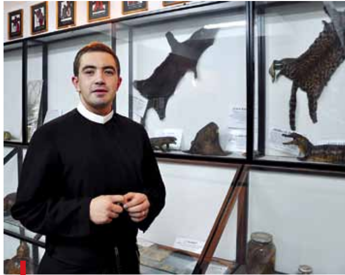
Redemptoryści misjonarze zawsze przywożą jakiś dar do Sali Misyjnej

Głównym zadaniem redemptorysty jest ewangelizacja wśród najuboższych. Ojcowie głoszą więc słowo Boże w ramach tzw. misji krajowych. Pracują też za granicą, w 18 krajach świata. Z placówek misyjnych przywożą oryginalne pamiątki: rzeźby, obrazy, stroje re-