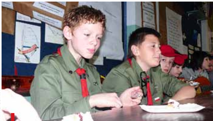
Wspólnym posiłkiem harcerzy i zuchów zrzeszonych w Hufcu ZHP im. Dzieci Głogowskich

GŁOGÓW. 100. rocznica powstania Związku Harcerstwa Polskiego była okazją do wspólnej modlitwy zuchów i harcerzy związanych z głogowskim Hufcem ZHP. Z tej okazji w kościele pw. NMP Królowej Polski 20 listopada odprawiono Mszę św. za żyjących i zmarłych członków hufca. Hufiec ZHP im. Dzieci Głogowskich swoim działaniem obejmuje teren powiatu głogowskiego i górowskiego. Zrzesza ok. 500 zuchów, harcerzy, instruktorów, sympatyków i przyjaciół ZHP. – Harcerstwo jest dla mnie całym życiem. Daje mi okazję do realizacji siebie, w pracy z ludźmi, w gronie