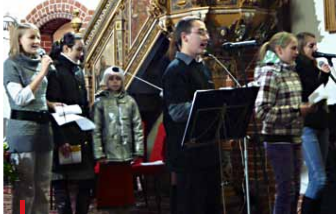
Parafialna schola swoim śpiewem pomaga jak najlepiej przeżywać liturgię. PONIŻEJ: Do leśnej kapliczki przychodzą się modlić tutejsi parafianie

Parafia współpracuje z Diecezjalnym Domem Rekolekcyjnym,