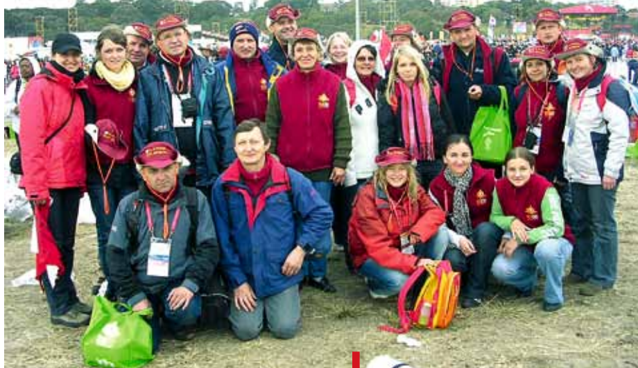
Grupa z diecezji opolskiej na ŚDM w Sydney w 2008 roku

Od 1985 r. w Niedzielę Palmową w Kościołach lokalnych na całym świecie obchodzimy Świato-