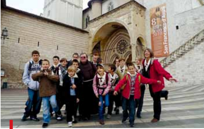
Przed bazyliką św. Franciszka w Asyżu