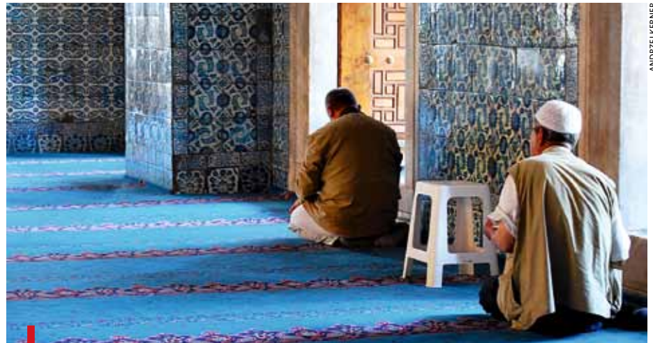
Modlitwa w meczecie w Stambule