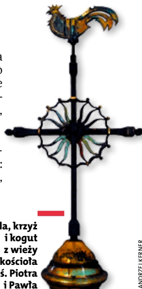
Kula, krzyż i kogut z wieży kościoła św. Piotra i Pawła

OPOLE. Podczas remontu wieży kościoła św. Piotra i Pawła w Opolu zdemontowano wieńczące je kulę, krzyż i koguta, które będą poddane renowacji. Podczas komisijnego otwarcia kuli wyjęto z niej słoik, w którym znajdował się dokument opisujący budowę kościoła w latach 1923–1924. W słoiku znalazło się również 6 używanych wówczas banknotów o nominałach: 10 miliardów marek, 20 miliardów marek, 50 miliardów marek, 100 miliardów marek i 200 miliardów marek oraz monety: 3 marki, 1 marka, 50 pfenigów, 20 pfenigów, 10 pfenigów, 2 pfenigi, 1 pfenig. Mimo tak szalejącej inflacji ks. prałat Józef Kubis zdołał wybudować duży kościół w ciągu półtora roku.