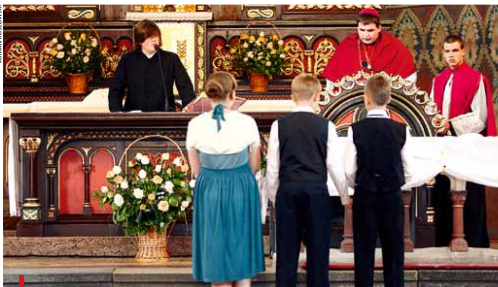
PARAFIALNA „GRUPA TEATRALNA” z BYKOWINY działa od pięciu lat i wystawiła wcześniej dwa spektakle o Janie Pawle II: „Wstańcie, chodźmy” oraz „Dar i tajemnica”