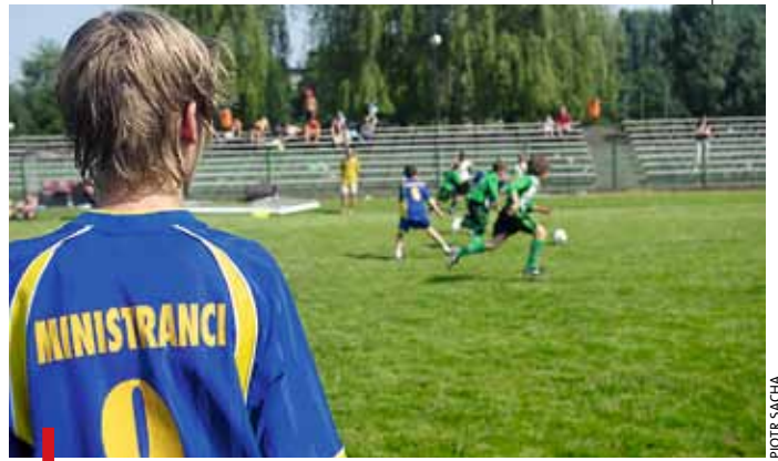
Finał: parafia św. Jadwigi w Rybniku kontra parafia św. Maksymiliana Kolbego w Tychach

Po ostatnim meczu turnieju podskoczyli w górę chłopcy z parafii św. Jadwigi w Rybniku, którzy pokonali w finale kolegów z Tychów 4:0. – Od kilku lat trenujemy co sobotę w sali gimnastycznej – tłumaczyli swój sukces. – Czasem gdy tego dnia mamy służbę, zamieniamy się z kolegami, żeby nie stracić