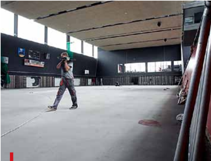
Remontowana po powodzi hala sportowa Gimnazjum nr 1 w Bieruniu Nowym