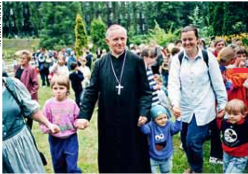
Jedno ze zdjęć prezentowanych na wystawie – Dzień Dziecka w ogrodach kurii, rok 1999