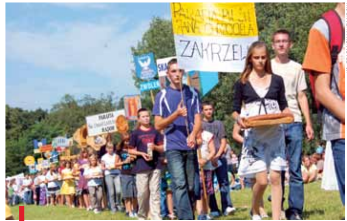
Procesja z darami podczas powakacyjnego Dnia Wspólnoty, który odbył się w radomskim seminarium

mat spraw, które się nagromadziły przez miesiąc, które są w małżeństwie do rozstrzygnięcia, jest bardzo ważne. To taki czas, kiedy trzeba zostawić codzienne obowiązki i rozmawiać na tematy, które są dla nich ważne.