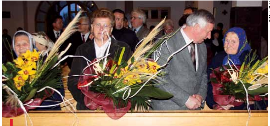
W uroczystości wzięli udział rodzice i bliscy kapłanów