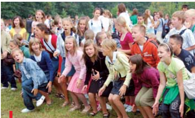
W oazie jest czas i na modlitwę, i na zabawę

Wszystkich zainteresowanych Ruchem Światło–Życie jego członkowie i opiekunowie zapraszają do współpracy. Szczegółowe informacje na temat Ruchu są na stronie www.radom.oaza.pl . Można też przyjść do siedziby oazy w Radomiu przy ul. Małczewskiego 1 w każdy wtorek i środę od 10.00 do 16.00.