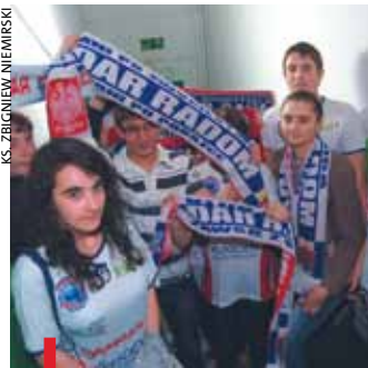
Na konferencję prasową przyszli kibice Jadaru, gotowi bronić ukochanego klubu

Jadar zagra w I lidze, a warszawska Politechnika w elicie. – Boli fakt, że zawodnicy, którzy wywalczyli sobie PlusLigę, muszą przenieść się do innych miast, a część straci pracę – napisali w oświadczeniu kibice radomskiej drużyny. pb