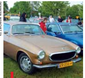
Żółte tablice rejestracyjne to dowód, że samochód posiada rangę szacownego zabytku