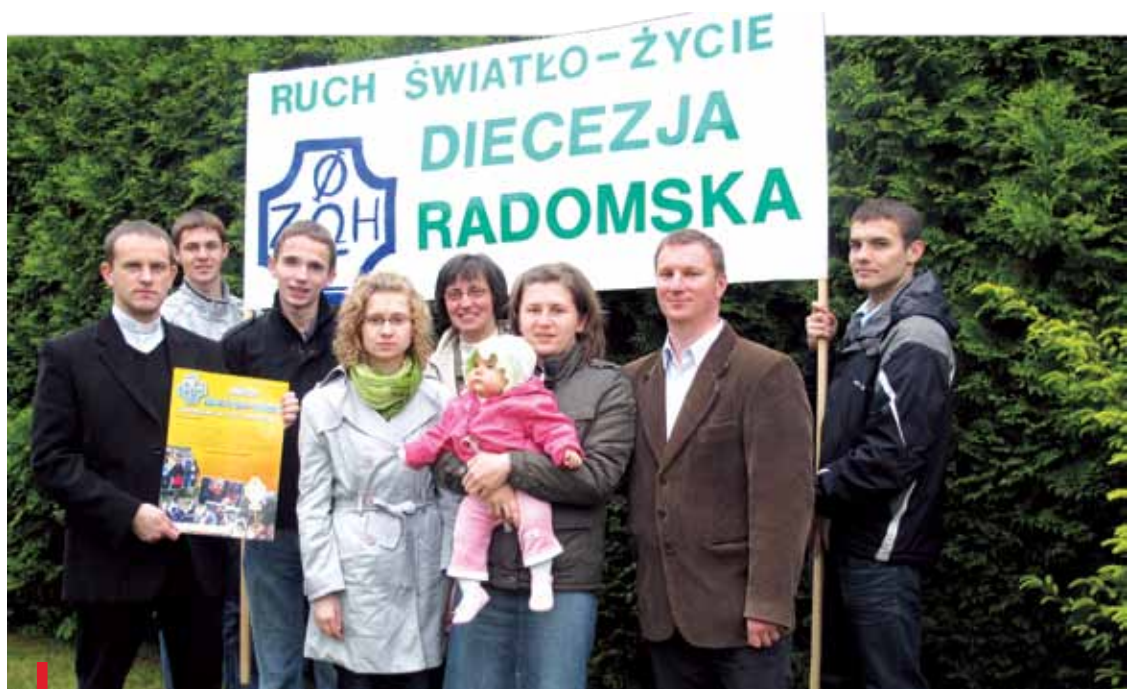
Nasi goście opowiadali o swojej działalności w Ruchu Światło-Życie

w Ruchu i wspominali wspólne rekolekcje i wyjazdy.