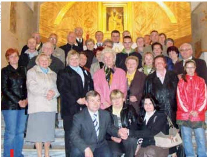
Członkowie Akcji Katolickiej zgodnie stwierdzili, że takie dni skupienia są bardzo owocne i dlatego należy je kontynuować