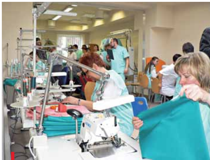
W szwalni znalazło zatrudnienie 27 niepełnosprawnych

własnych. Nowy zakład pracy zatrudnia 27 osób niepełnosprawnych, pracujących na dwie zmiany. Wszystkie stanowiska pracy dostosowane są do potrzeb wynikających z rodzaju i stopnia niepełnosprawności pracowników. To już drugi zakład tego typu w Rudzie Śląskiej. Pierwszy ZAZ – Zakład Usług Pralniczych został utworzony w 2004 roku.