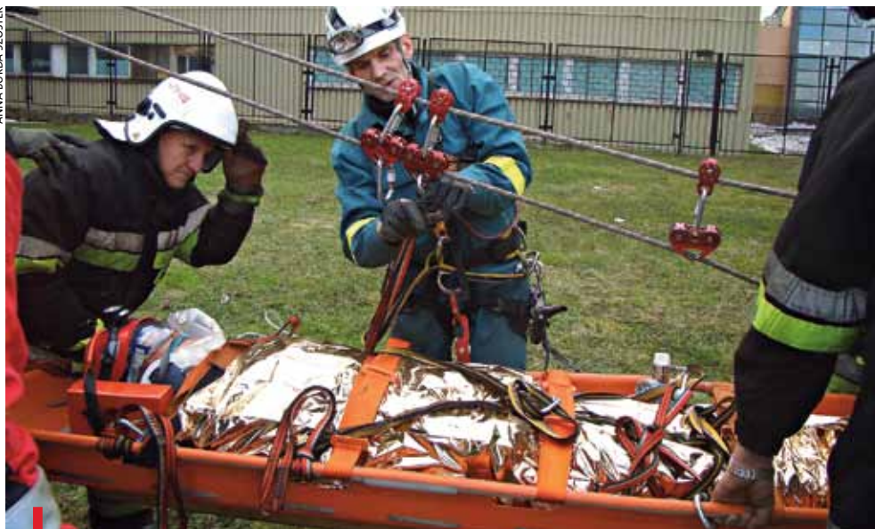
JASTRZĘBIE-ZDRÓJ. Ratownicy na linach wyciągnęli rannego z zawalonego budynku

W budynku nieużytkowanego basenu w Jastrzębiu-Zdroju 4 marca, podczas prac rozbiórkowych, zawalił się dach. Dwóch robotników zostało przysypanych gruzem i przygniecionych elementami budowlanymi. W akcji ratowniczej uczestniczyło 35 osób z oddziałów poszukiwawczo-ratowniczych Państwowej Straży Pożarnej z Jastrzębia i Centralnej Stacji Ratownictwa Górniczego z Bytomia, Ochotniczej Straży Pożarnej oraz dwa psy ratownicze. Po zlokalizowaniu i udzieleniu pierwszej pomocy poszkodowanych ewakuowano na zewnątrz budynku przy użyciu technik alpinistycznych. Na szczęście były to tylko bardzo widowiskowe ćwiczenia jednostek ratowniczych. Ich celem było doskonalenie technik poszukiwawczo-ratowniczych i ocena praktycznych możliwości współpracy oddziałów ratunkowych.