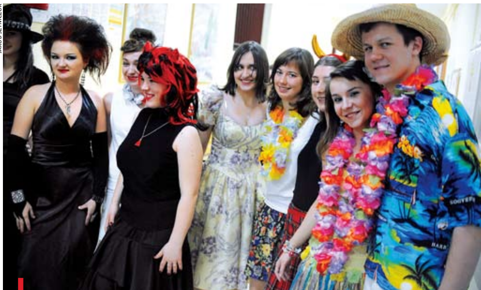
WARSZAWA, 6 LUTEGO. Studenci z „Soli Deo” bawili się na balu przebierańców

To już ostatnie dni karnawału i ostatnie karnawałowe szaleństwa. 6 lutego w Liceum im. Lajosa Kossutha w Warszawie na tradycyjnym balu bawili się studenci z Akademickiego Stowarzyszenia Katolickiego „Soli Deo”. Po zabawie zabrali się do pracy przy przygotowaniach ostatniego sezonu spotkań z cyklu „Poruszyć Niebo i Ziemię”. Cykl od półtora roku stara się przełamywać stereotypy o katolikach i Kościele. Wzięto w nim udział wielu znamienitych gości i tysiące słuchaczy. Teraz planowane są dwa bloki spotkań: w marcu ruszą rozmowy o wartościach, a pod koniec kwietnia i w maju spotkania pod wspólnym tytułem „Wygrać Życie”. Relacje z poprzednich dyskusji i warsztatów oraz sylwetki gości można znaleźć na stronie: www.solideo.pl .