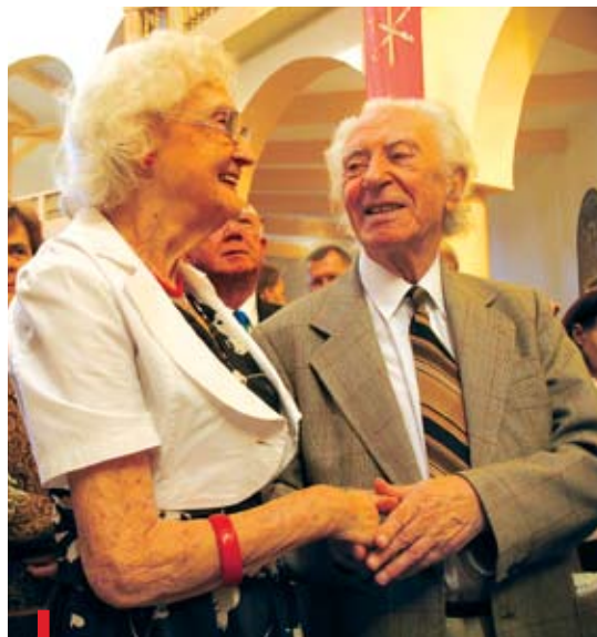
Każdemu marzy się miłość piękna i wierna

Na walentynkowe spotkanie „W poszukiwaniu prawdziwej miłości” zaprasza na godz. 20.30 Grupa „33” z parafii Nawrócenia Świętego Pawła (ul. Kobielska 10). W intencji zakochanych i narzeczonych 14 lutego o godz. 18.00 w kościele bł. Władysława z Gielniowa zostanie odprawiona Msza św., połączona ze specjalnym błogosławieństwem par, przygotowujących się do zawarcia