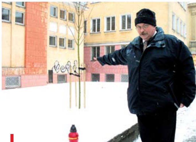
W tym miejscu, zdaniem Stefana Świetliczki i innych historyków, wznosiła się Kaplica Moskiewska

głośna i nabrała charakteru politycznego, o konsultację poproszono profesora historii Rosji na Uniwersytecie Warszawskim, Dymitra Cwietajewa. Ten stwierdził, że to nie żadna kaplica, ale zwykła ogrodowa altana. Na potwierdzenie swojej opinii wydał nawet dwutomowe dzieło o miejscu pochówku cara w Polsce, wskazując na Pałac Staszica. Pod wpływem tej opinii, przebudowano pałac w stylu bizantyjsko-ruskim, a na pamiątkę miejsca spoczynku cara w jego wnętrzu urządzono cerkiew.