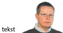
tekst TOMASZ GOŁĄB redaktor wydania

T ydzień Modlitw o Jedność Chrześcijan w pełni. Czytelnikom przedstawiamy więc kościoły chrześcijańskie, w których odbywają się właśnie ekumeniczne spotkania. Trwać będą właściwie do końca stycznia. Zanim wyjedziemy na ferie, może warto przyjść na jedno z nich i wspólnie z innymi chrześcijanami pomodlić się do wspólnego Ojca. W numerze piszemy także o tajemnicach Kaplicy Moskiewskiej. Mało kto wie, że budowała stojąca przez kilka wieków przy Trakcie Królewskim służyła m.in. za prawosławne mauzoleum dla carskiej rodziny.