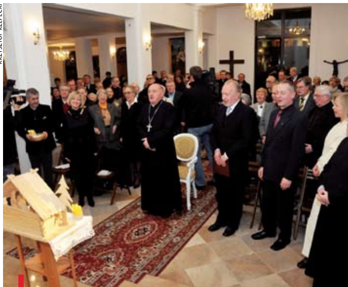
– Kościół potrzebuje ludzi sztuki we wszystkich przejawach ich aktywności – mówił abp Nycz

PLAC TEATRALNY. Artyści mogą się angażować w ewangelizację w parafiach, zwłaszcza ludzie młodych – mówił metropolita warszawski abp Kazimierz Nycz, podczas spotkania opłatkowego w kościele św. Andrzeja Apostoła i św. Brata Alberta, przy pl. Teatralnym. Spotkanie opłatkowe rozpoczęło się od przedstawienia: „Koleś na cztery głosy”, inspirowanego tradycją jasełek i tekstami kolęd. W imieniu zgromadzonych twórców do metropolity warszawskiego abp. Kazimierza Nycza zwróciła się Małgorzata Bogdańska, aktorka stołecznego Teatru Ochota. Abp Nycz podkreślił, że