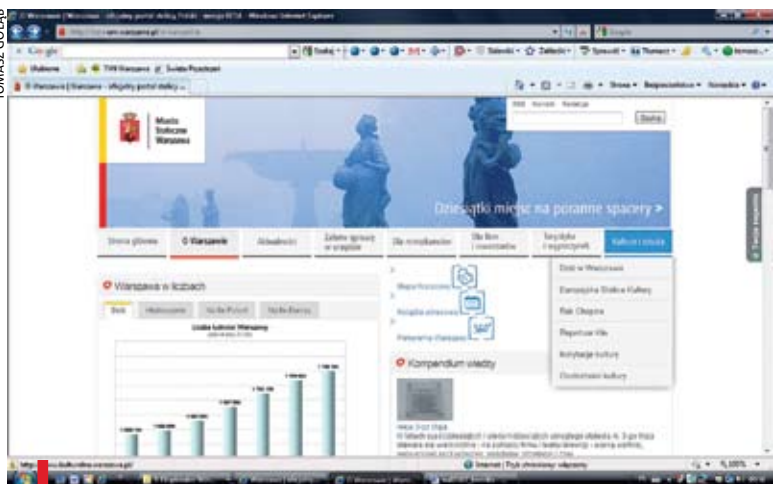
Nowy portal Warszawy jest na razie w fazie testowej

Tekieli – dyrektor Stołecznego Biura Turystyki. – Strona jest pomyślana jako swoiste kompendium wiedzy dla turystów zagranicznych. Służy wszystkim poszukującym praktycznych informacji o Warszawie. Dzięki nowemu portalowi Warszawa otwiera się na społeczności internetowej – już dziś można dołączyć do grupy fanów Kulturalnej Warszawy na Facebooku, oglądać filmy z serwisu na YouTube, jak również śledzić miasto na Blipe, Twisterze i innych portalach społecznościowych. Nowością jest dodany do nowego portalu syntezytor mowy Ivona, pozwalający osobom niedowidzącym na słuchanie publikowanych treści.