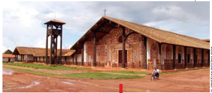
O. KRYSZTIAN PIECZKA OFM