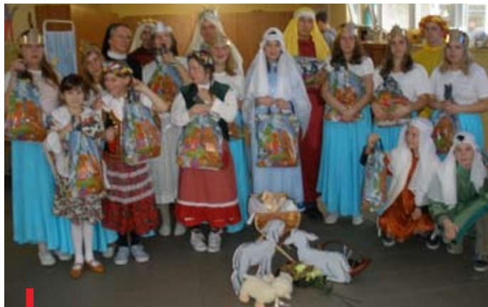
Dzieci i młodzież ze szkoły specjalnej otrzymały świąteczne podarunki

Przez pierwsze trzy tygodnie Adwentu trwało zbieranie darów. Większość osób pozostała anonimowymi darczyńcami, składając zabawki, pomoce szkolne czy słodkości m.in. w kościele przed obrazem Jezusa Miłosiernego. Następnie organizatorzy akcji