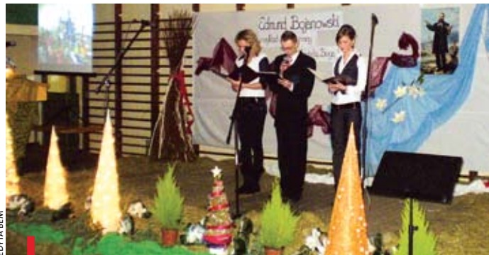
Projekt zrealizowano z okazji 10. rocznicy beatyfikacji bł. Edmunda