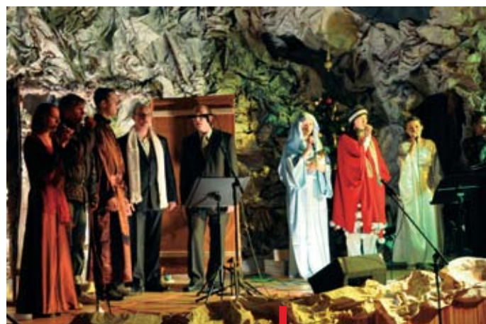
Attonare tym razem w repertuarze kołędowym

Przedstawienie zatytułowane „Wyjątkowy...” rozpoczęła piosenka „Gdybyś Panie”, po której w kilku scenach zobaczyliśmy m.in. dzieci spieszące do domów na kolację wigilijną czy bezdomnego, dla którego Boże Narodzenie jest najpiękniejszym dniem w roku. A skąd tytuł? Jeden z bohaterów wyjawia, że chce stać się człowiekiem wyjątkowym, wierząc, że wiedza, pieniądze i kontakty są wyznacznikami człowieka wyjątkowego. Tymczasem poszczególne sceny prowadzące widzów do lichej