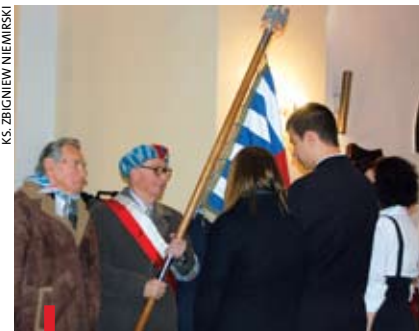
Byli więźniowie obozów koncentracyjnych przekazują sztandar młodzieży