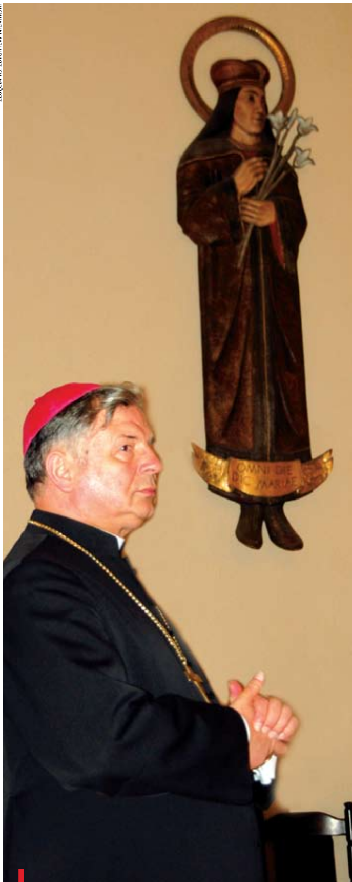
Bp Henryk Tomasik w kaplicy radomskiego Wyższego Seminarium Duchownego. W tle figura św. Kazimierza, patrona naszej diecezji