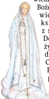
Figura Matki Bożej Fatimskiej w kościele św. Jana Chrzciciela, który dziś pełni funkcję sali koncertowej

W październiku w tak trudnej dla nas sytuacji naszą parafię nawiedziła figura Matki Bożej z Fatimy. Przywieźli ją do nas księża pallotyni z sanktuarium w Dowbyszu. Przeżyliśmy cudowne doświadczenie. Celebrowaliśmy Eucharystię, była procesja naokoło kościoła,