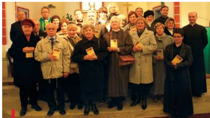
Nowi członkowie Dzieła Biblijnego będą zachęcać do codziennej lektury Pisma Świętego