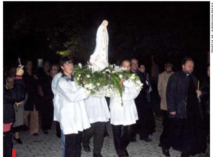
Parafianie procesyjnie nieśli figurę wokół kościoła

modliliśmy się na różańcu. Wiał bardzo silny wiatr. Byliśmy niejako przez niego prowadzeni. Wszyscy dostrzegliśmy w nim obecność Ducha Świętego między nami.