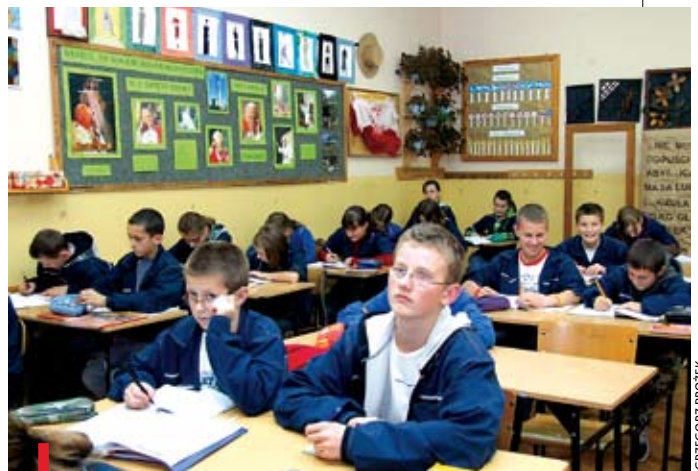
W programie uczestniczy 200 uczniów łabowskiego gimnazjum

Naszą uwagę wobec zbliżającego się końca roku liturgicznego winniśmy skierować nie na zapowiedź zaćmienia Słońca ani na mający nastąpić deszcz spadających gwiazd, ale na fakt, że zbliża się moment naszego osobistego spotkania z Chrystusem. Mimo iż nie potrafimy wyliczyć nawet w przybliżeniu, kiedy to nastąpi, możemy być całkowicie pewni, że do tego spotkania dojdzie, nawet gdyby ktoś nie całkiem w nie wierzył. Ta chwila „blisko jest, we drzewiach”. W każdej minucie już o minutę bliżej. Nie chodzi o to, by się bać, ale by wykorzystać możliwość przygotowania się na to spotkanie. ■