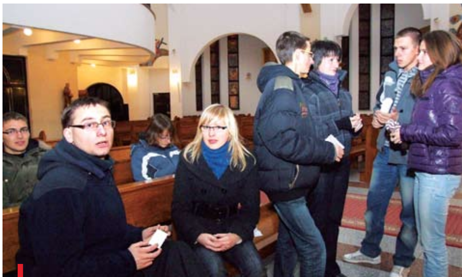
Członkowie KSM w Koszycach Wielkich podkreślają, że bł. Karolina scementowała ich wspólnotę