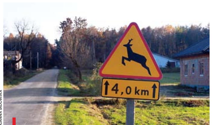
Leśna zwierzyna zagraża nie tylko kierowcom, ale i rolnikom