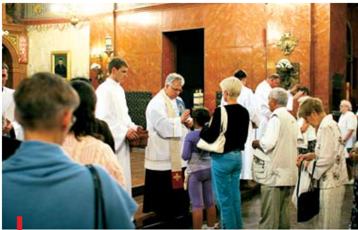
Każdy uczestnik liturgii otrzymał osobiste błogosławieństwo jubileuszowe z odpustem