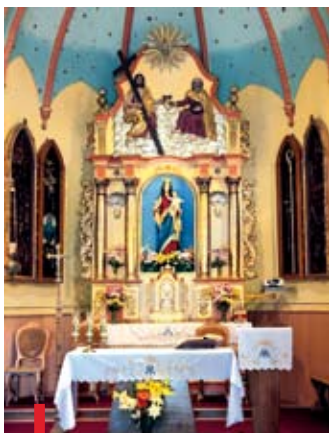
Ołtarz przyłękowskiego sanktuarium PONIŻEJ: Studnię z kołowrotem przy cudownym źródleku zastąpią wkrótce wygodne kurki

Odnowieniem figury Matki Bożej Wspomożycielki Wiernych w Przyłękowie rozpoczęto przygotowania do obchodów ćwierćwiecza tutejszej parafii. Jednak historia sanktuarium liczy już ponad 120 lat.