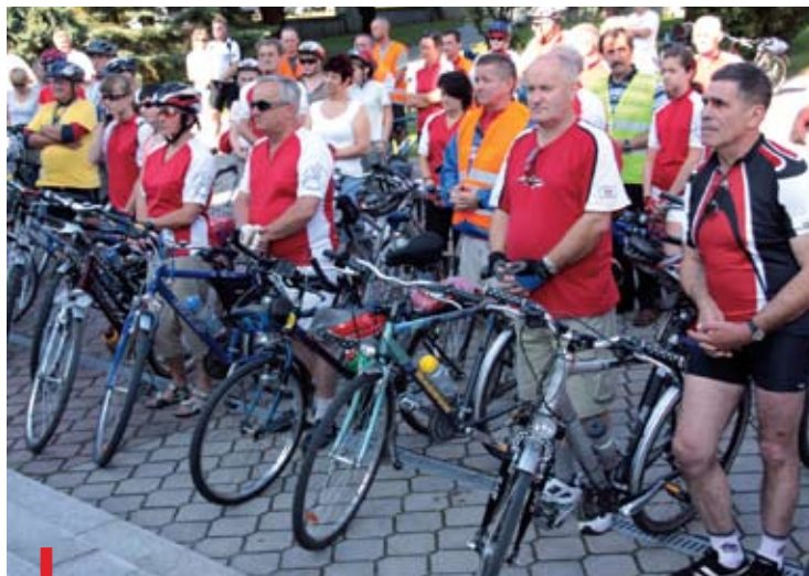
Rowerzyści po raz szósty wyruszyli z Pisarzowic na Jasną Górę

Rowerowa pielgrzymka z Pisarzowic pojechała na Jasną Górę już po raz szósty.