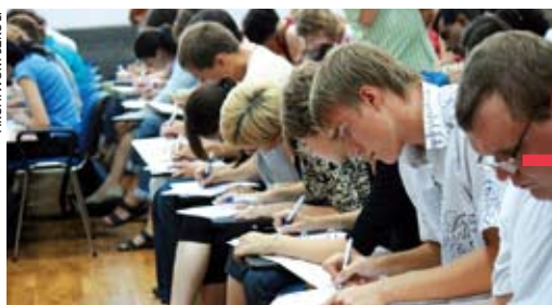
Studenci letniej szkoły będą poznawać język i kulturę Polski

CIESZYN. XIX Letnia Szkoła Języka, Literatury i Kultury Polskiej, organizowana co roku przez Szkołę Języka i Kultury Polskiej Uniwersytetu Śląskiego, rozpoczęła działalność 31 lipca w cieszyńskim gmachu Uniwersytetu Śląskiego, a zakończy ją 27 sierpnia. Wszyscy uczestnicy letniej szkoły napisali test kwalifikacyjny, który posłużył do oceny ich poziomu znajomości języka polskiego i pozwolił