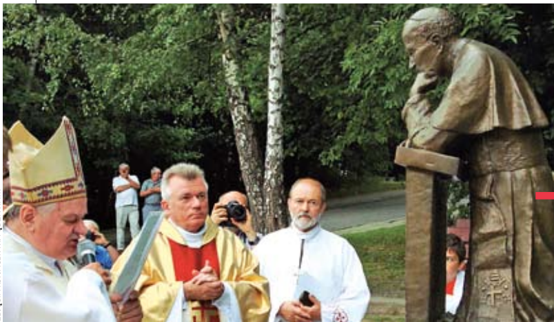
Zatopiony w modlitwie Jan Paweł II spogląda w kierunku centrum Ustronia