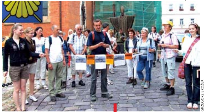
5 lipca odbyło się pierwsze przejście szlakiem św. Jakuba z Tarnowa do Tuchowa