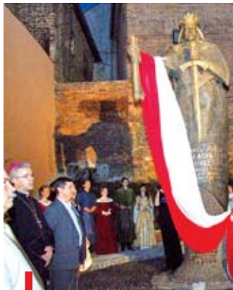
Skwer z pomnikiem stał się jednym z najbardziej malowniczych zakątków Tarnowa