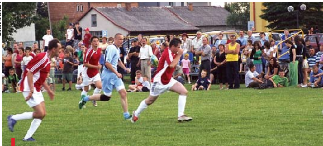
Goniąc piłkę, łapię zdrowie

Tegoroczne hasło roku duszpasterskiego w Kościele można w prosty sposób próbować przełożyć na konkrety , jak czynią to w Lisiej Górze.