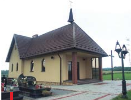
Od pięciu lat parafia posiada pięknie urządzone cmentarz. Po LEWEJ: Kościół był konsekrowany w 1992 r.

Najwyraźniej bardzo szanują życie , bo mają cmentarz tak piękny, że wielu spośród odwiedzających go deklaruje, iż mogłoby tu spocząć.