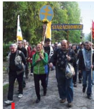
Pielgrzymi zbliżają się do sanktuarium