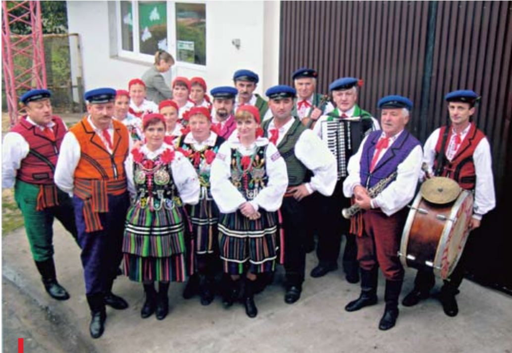
W czasie uroczystości religijnych występuje miejscowy zespół folklorystyczny

Proboszcz parafii to jedyny ksiądz w naszej diecezji, który przyjął święcenia kapłańskie z rąk Ojca Świętego Jana Pawła II.