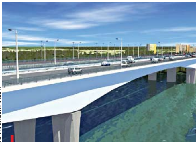
Trasa Mostu Północnego ma docelowo połączyć Trasę NS ze wschodnią obwodnicą Warszawy