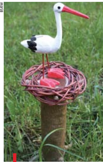
Statuetki Białych Bocianów wręczono po raz czwarty