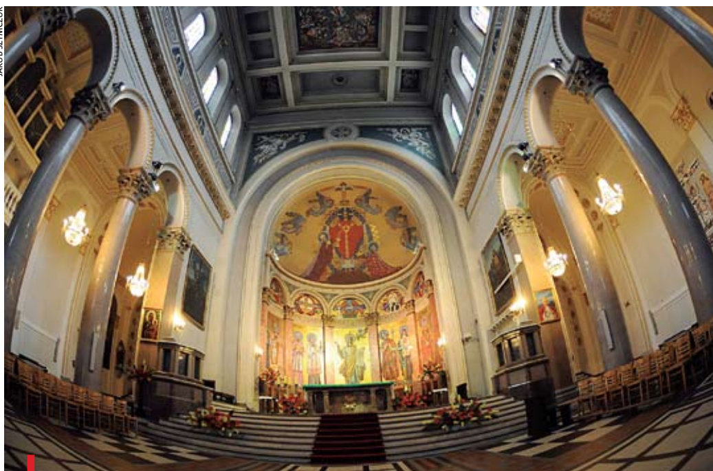
Freski w prezbiterium wzorowane są na sztuce bizantyjskiej. Przedstawiają świętych czczących Serce Pana Jezusa oraz samego Jezusa w mandorli wraz z personifikacją Kościoła i Polski.