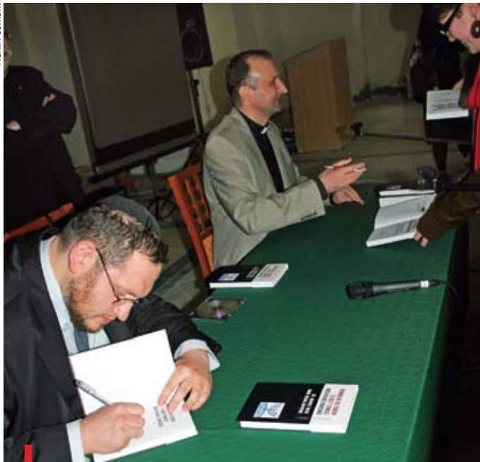
Rabin i ksiądz wspólnie podpisują książkę