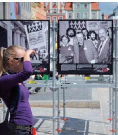
Wystawa pokazuje zapomniany klimat ostatniego roku komunistycznej rzeczywistości we Wrocławiu

Zdjęcia kolejek po chleb, ulicznych demonstracji i codziennego życia wrocławian wraz z cytatami z prasy komunistycznej i niezależnej. Ten niezwykły zapis ostatniego roku komunizmu w stolicy Dolnego Śląska można oglądać na wrocławskim rynku.