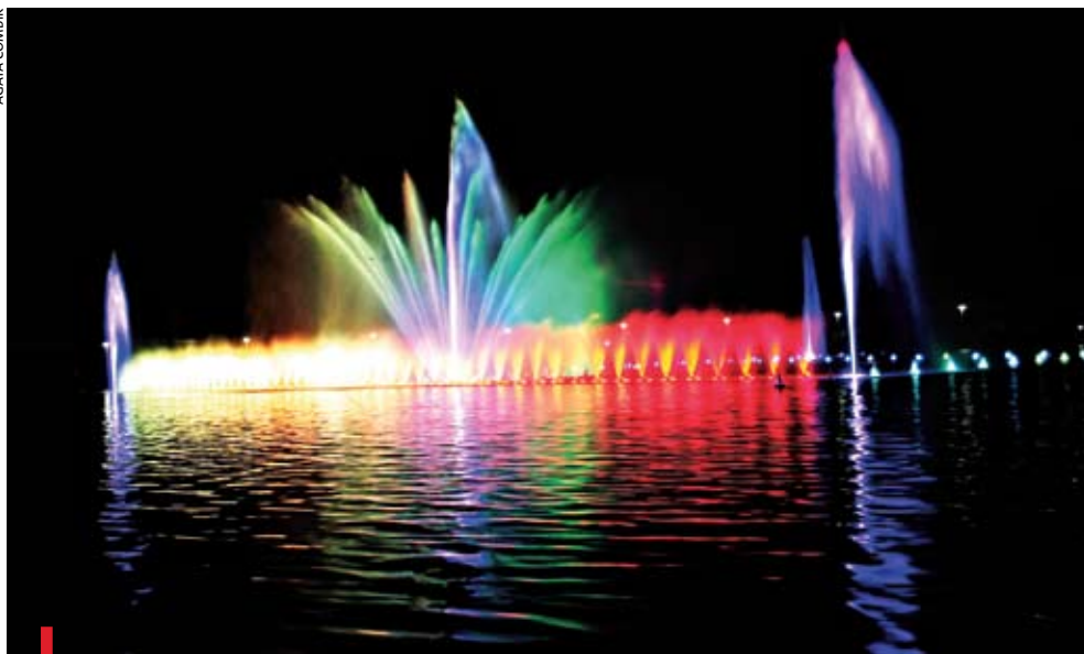
Wrocław. Multimedialna fontanna ma stać się kolejnym symbolem miasta

Wyfruwały z niej ptaki, wyrażały krajobrazy, wirowały sprężyny i strzelały płomienie. Po fontannie przy Hali Stulecia od początku spodziewano się wiele, ale gdy trysnęła uroczyście 4 czerwca, w rocznicę wyborów 1989 r., i tak wprawiła z zdumieniem tłumy widzów. Kilkaset dysz strzelających wodą, wspartych muzyką i światłem, spełniło swe zadanie. Niestety, nie wszystkie niespodzianki były miłe – dwóch wrocławian zraniły petardy, a jadąca karetka miała problem z dotarciem do nich. Mimo że po zakończonym widowisku wielu widzów pozostało jeszcze długo przy szmerzącej fontannie, w okolicy natychmiast utworzył się gigantyczny korek. Czy aby nowa atrakcja miasta nie dostarcza nam zbyt wielu mocnych wrażeń?