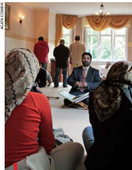
Imam Ali Abi Issa na spotkaniu w meczecie