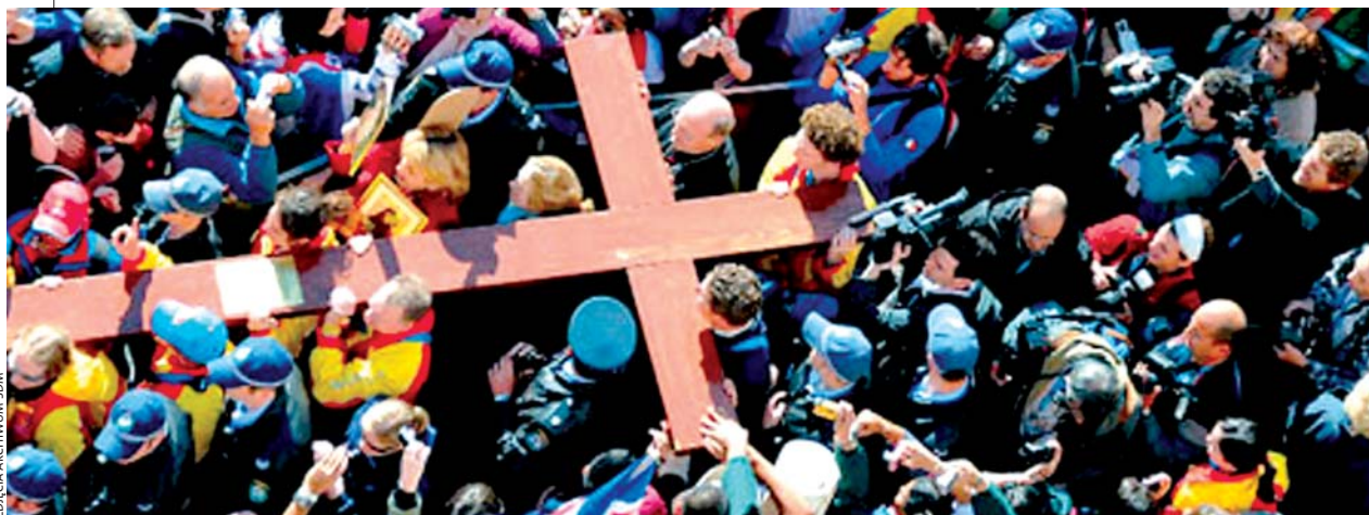
ZDJEŃCA ARCHIWUM SDM