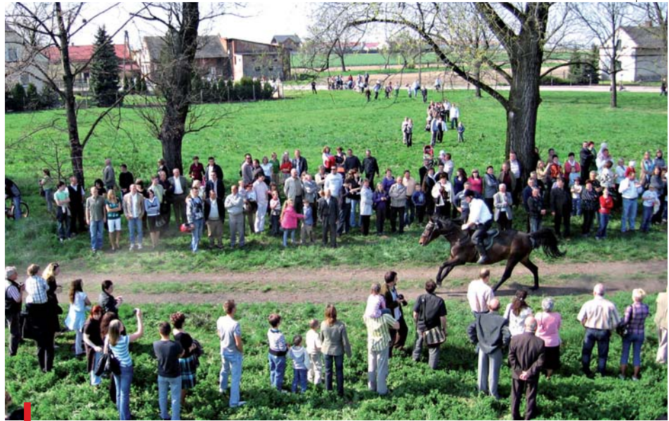
Galop wzbudza wielkie emocje