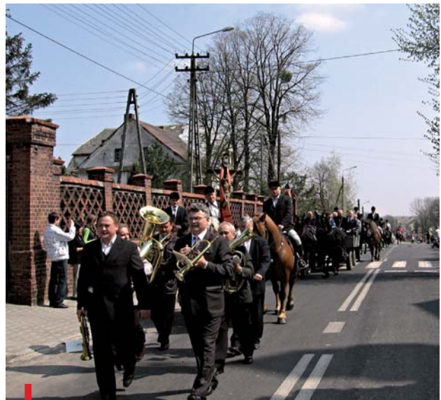
Orkiestra na czele