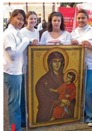
Te dwa symbole papieskiej miłości Jana Pawła II do młodych pokonują każdego roku długą drogę, aby młodzi całego świata mogli spotkać przy nich Jezusa Chrystusa

Dzięki aprobacie Papieskiej Rady ds. Świeckich i Sekretariatu Stanu Stolicy Apostolskiej przekazanie krzyża delegacji polskiej nastąpi w Rzymie 22 kwietnia podczas audjencji generalnej. 25 kwietnia w godzinach porannych krzyż i ikona ŚDM zostaną przetransportowane samolotem z Rzymu do Katowic, by stamtąd rozpocząć pielgrzymkę po diecezjach w Polsce. Jedną z pierwszych diecezji, które przyjmą te cenne symbole 27 i 28 kwietnia 2009 roku, będzie diecezja opolska. W związku z tym pragnę zaprosić