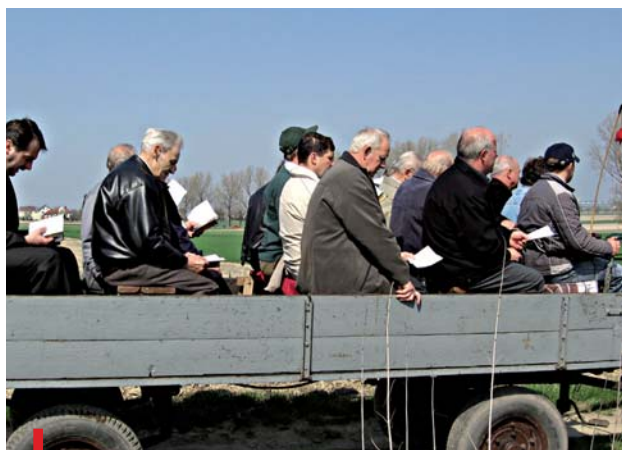
Śpiewacy na wozie