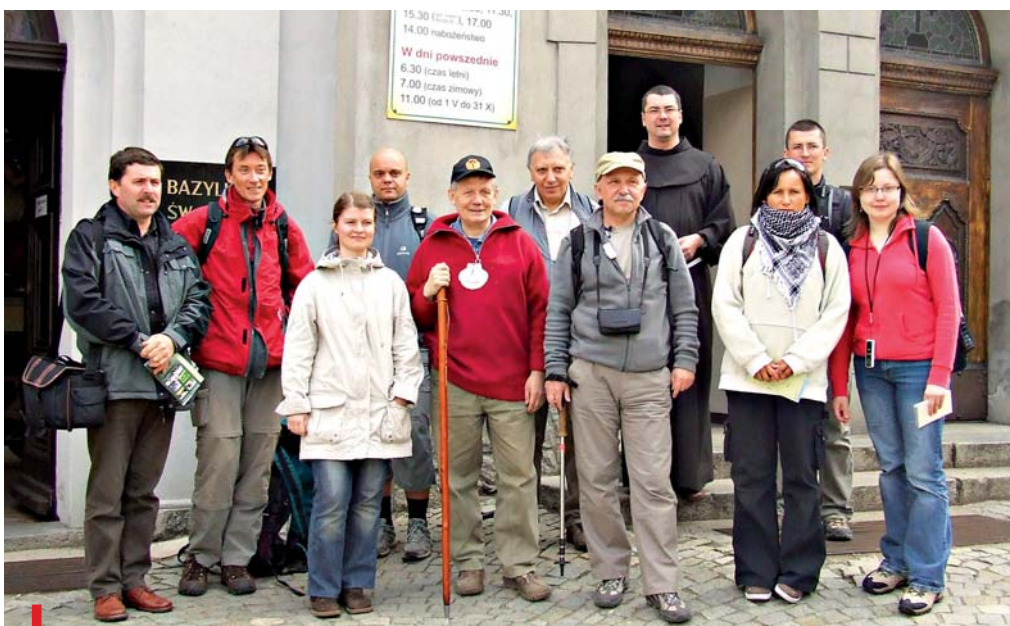
Pielgrzymi wraz z ojcem Salezszym przed bazyliką św. Anny

18 kwietnia na Górze św. Anny rozpoczął się cykl weekendów na Via Regia organizowanych przez Fundację Wioski Franciszkańskiej.