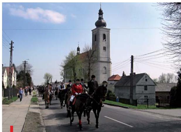
Procesja wyrusza spod kościoła parafialnego