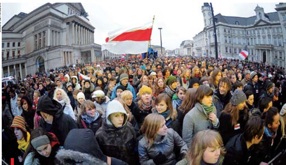
WARSZAWA. Już po raz czwarty Warszawa solidaryzowała się z Białorusią. Tłumy mieszkańców przyszedł tym razem na Plac Teatralny