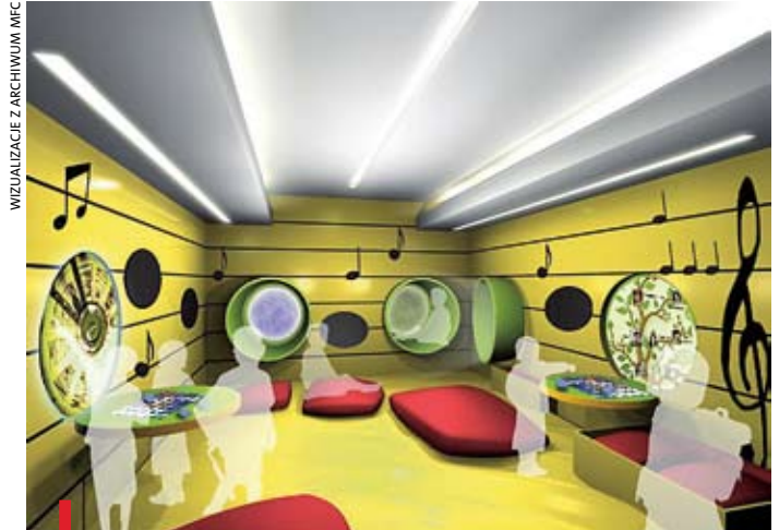
WIZUALIZACJE Z ARCHIWUM MFC

Oryginalne XIX-wieczne manuskrypty są trudne do przechowywania w muzeach, bo wymagają odpowiednich warunków: temperatury, wilgotności, etc. Kiedy już muzealnicy przebrną przez te trudności, to i tak nie nacieszą się zainteresowaniem zwiedzających, bo iluż z nich zechce studiować pożółkłe kartki papieru zapisane wyblakłym i często niezbyt czytelnym pismem? Muzeum Chopina zlikwiduje te bariery. Listy Chopina i do Chopina można nie tylko obejrzeć za szkłem, ale i wysłuchać fragmentów w znakomitych