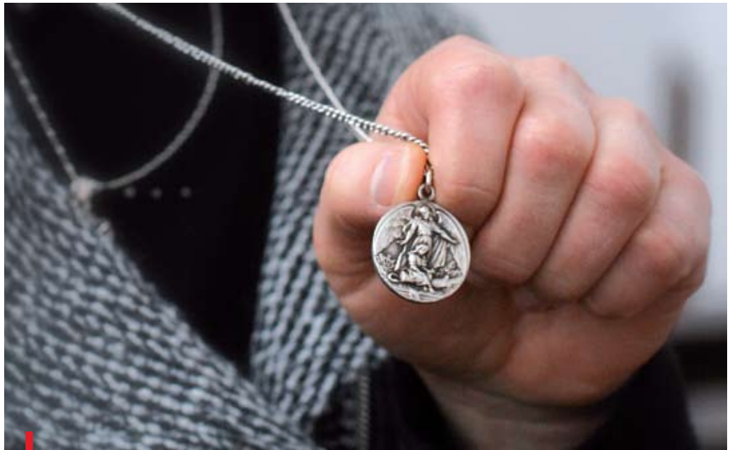
Siostry noszą charakterystyczny medalik: z jednej strony Święta Rodzina – jako symbol ukrycia, z drugiej – anioł pochylony nad dzieckiem

Gdy powstawało stowarzyszenie, siostry – bardzo często z ziemskich i szlacheckich rodów na terenie Wileńszczyzny – starały się być blisko przede wszystkim dzieci i młodzieży. Prowadziły warsztaty rzemieślnicze, bursy, tajne komplety. W ochronkach