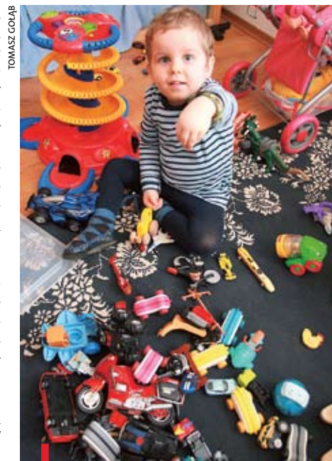
Pierwsze lata życia malucha są bardzo ważne dla jego rozwoju