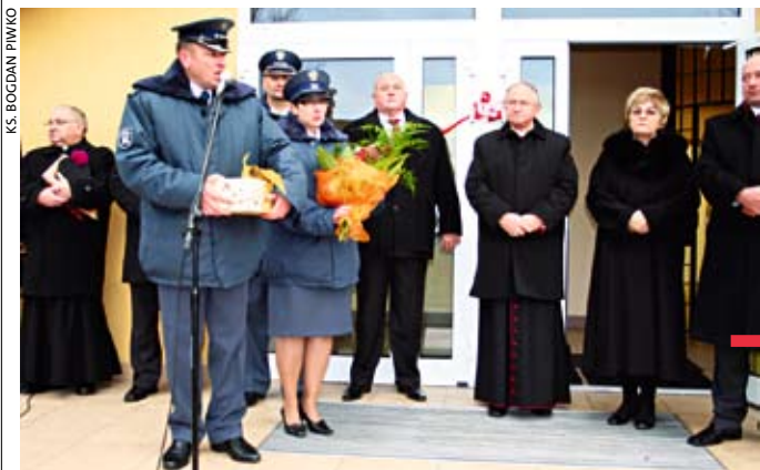
Pamiętką jubileuszu będą sztandar i nowoczesny budynek administracyjny.

P ołożony na terenie gminy Garbatka-Letnisko Zakład Karny w Żytkowicach obchodził 25-lecie istnienia. Jest to jednostka typu półotwartego, przeznaczona dla dorosłych