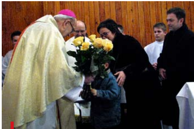
Kwiaty dla księdza biskupa były wyrazem wdzięczności za utworzenie parafii