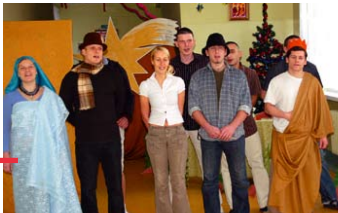
Młodzież bardzo sugestywnie odegrała swoje role w jasełkach

mówili o miłości, której niestety zabrakło w ich rodzinnych domach, ale mogą odnaleźć ją przy Chrystusie, który narodził się w Betlejem. Młodzież oklaskiwali pracownicy oddziału i członkowie naszej redakcji. kmg