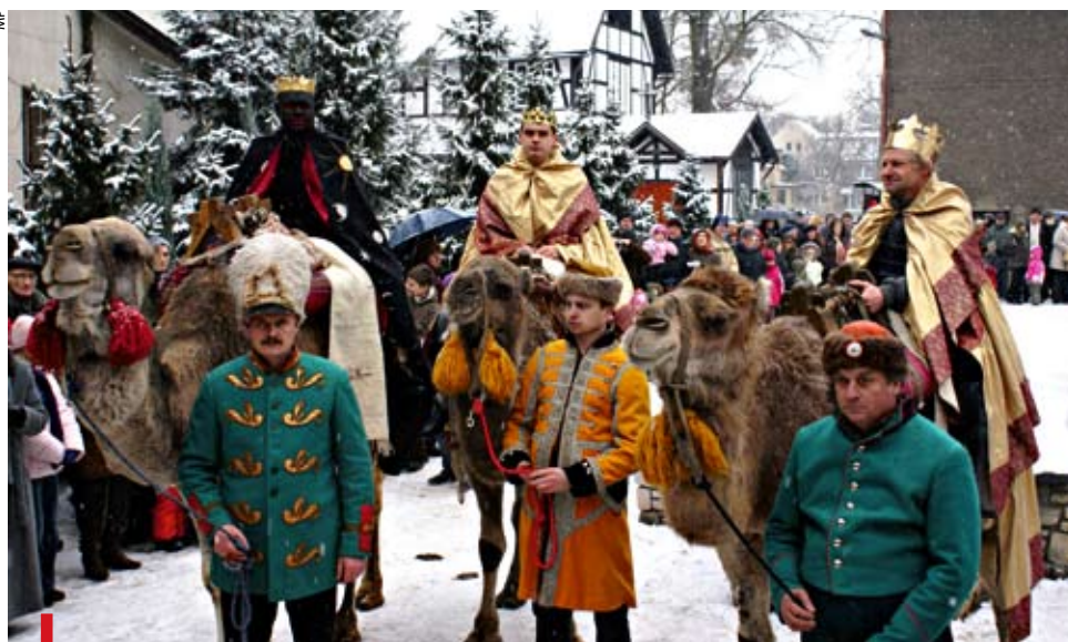
WROCLAW, PARAFIA PW. MB POCIESZENIA, 4 STYCZNIA 2009. W tym roku niebo rozpostarło przed Trzema Królami śnieżnobiały kobierzec

Trzej Królowie przyjechali na wielbłądach, niespiesznie, zatoczyli krąg przed żłóbką, a następnie złożyli hołd nowo narodzonej Dziecinie, składając dary: mirrę, kadzidło i złoto. Podarunki odebrał św. Józef. We Wrocławiu Trzech Króli nie zdziwiły ani wieżowce w tle szopki, ani gęsty śnieg, jaki padał w tym roku podczas ich wędrówki do parafii redemptorystów. Przybywają w to samo miejsce od lat, dzięki uprzejmości sąsiada – dyrekcji zoo. Stamtąd też wypożyczane są zwierzęta do szopki, w tym ulubieniec dzieci – osiołek.