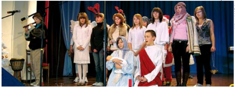
Uczniowie Gimnazjum nr 8 w Bielsku-Białej w swojej prezentacji kolędy o Trzech Królach

W programie m.in.: zabawa prowadzona przez wodzireja i orkiestrę, minirecital Marty i Rafała Sawickich – aktorów Teatru Polskiego w Bielsku-Białej, aukcja obrazów, loteria fantowa, wybór króla i królowej balu, konkursy z nagrodami, pokazy tańca towarzyskiego. Cena biletów – 150 zł od pary; rezerwacja – pod numerem telefonu stowarzyszenia: (033) 814 88 66 lub (033) 810 12 55 od poniedziałku do piątku od 9,00 do 16,00. im