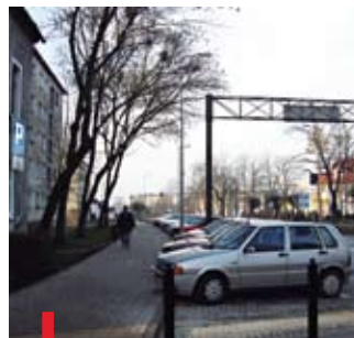
Z roku na rok Bolesławiec pięknieje, co widać na każdym kroku

BOLESŁAWIEC. Chodniki wzdłuż al. Tysiąclecia oraz przy ul. Spokojnej zostały wyremontowane. Zniszczone i wysłużone płyty