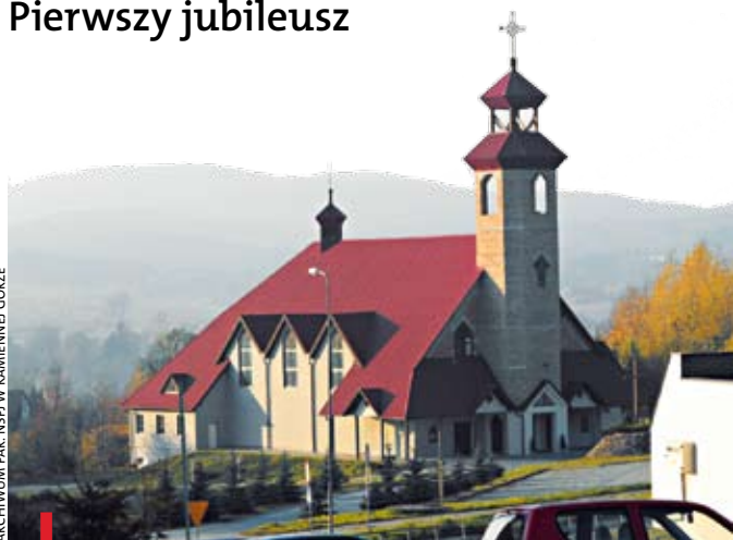
Kościół parafialny pw. NSPJ pięknie dziś góruje nad Kamienną Górą

KAMIENNA GÓRA. Parafia pw. Najświętszego Serca Pana Jezusa obchodziła w grudniu swój jubileusz. W 20. rocznicę erygowania parafii odprawiono jubileuszową Eucharystię. Uroczystość zorganizowano w rocznicę odprawienia pierwszej Mszy świętej. Tę z kolei sprawowano 4 grudnia 1988 roku w starym baraku pozostawionym przez ekipy