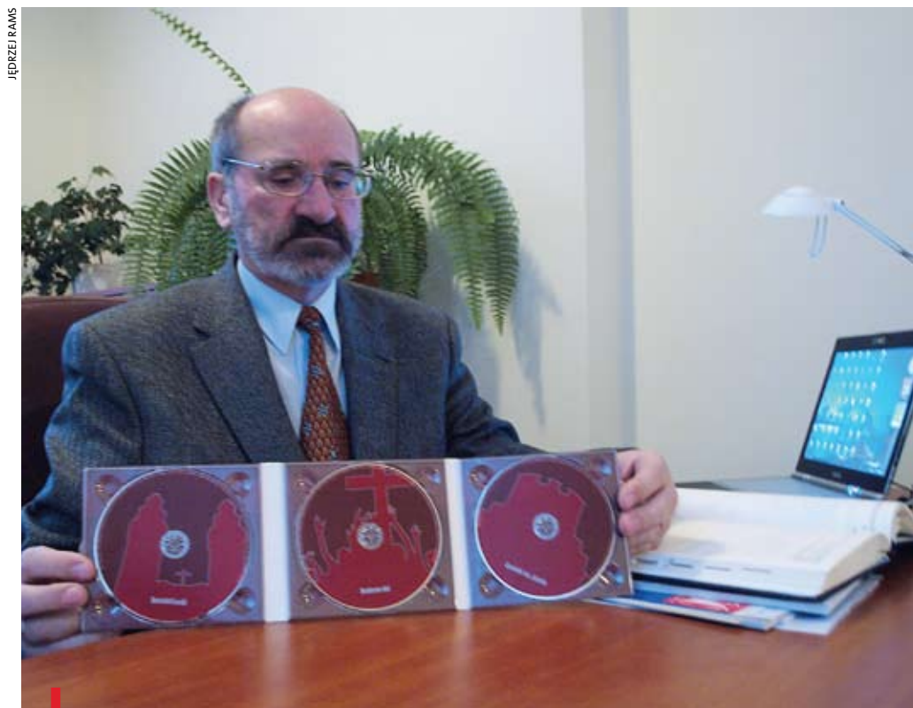
Najnowsza publikacja przygotowana przez biuro, to zbiór filmów o opactwie cysterskim pt. „Tryptyk Krzeszowski”

Czyli biuro zajmuje się głównie opactwem cysterskim?