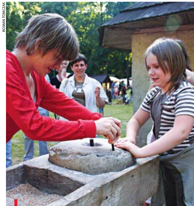
Na czas Dymarek Kaczawskich Leszczyna przenosi się w czasie kilka wieków wstecz

Innym pozytywnym przykładem zaradności parafian jest wynajmowana salka w ostatniej wsi parafii, w Leszczynie.