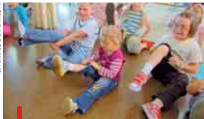
Mali artyści muszą osiąść sztukę odróżniania lewej nogi od prawej