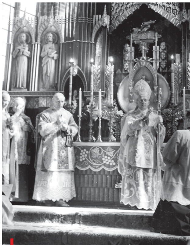
Pierwsze biskupie błogosławieństwo po konsekracji w katedrze gorzowskiej 7 września 1958 roku. OBOK: kard. Stefan Wyszyński