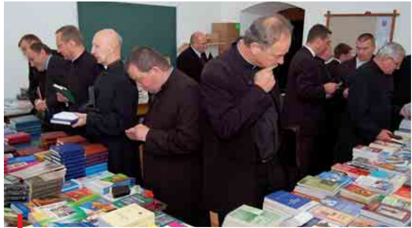
Jak zwykle zainteresowaniem cieszyło się stoisko Diecezjalnej Księgarni św. Antoniego

Przyszły rok liturgiczny przeżywać będziemy pod hasłem: „Otoczmy troską życie”. Najważniejszym wydarzeniem będzie 20-lecie koronacji obrazu MB Rokitniańskiej.