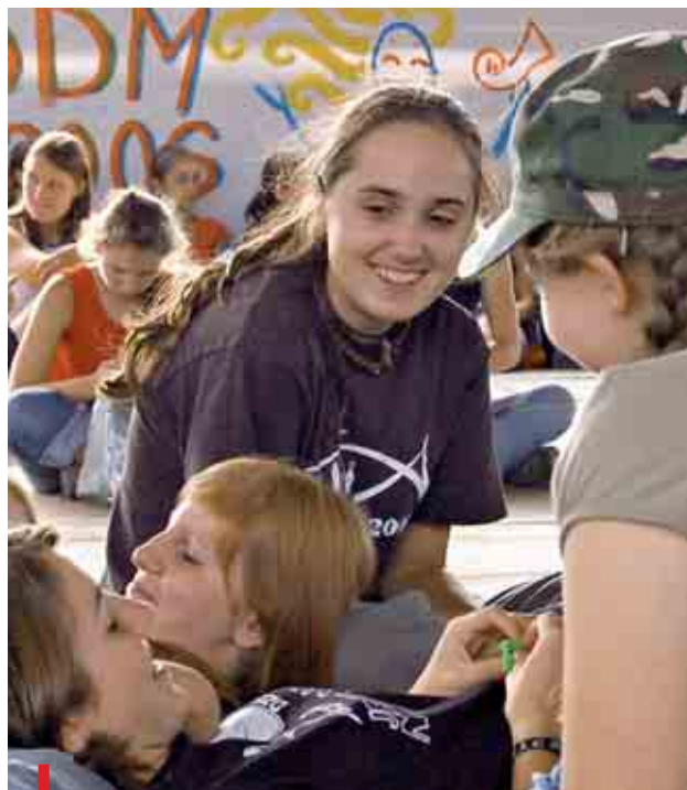
Tegoroczne Diecezjalne Dni Młodych odbędą się od 19 do 21 września przy kościele pw. Ducha Świętego w Zielonej Górze