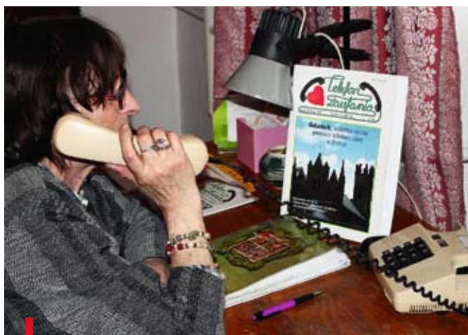
Anonimowi przyjaciele czekają przy telefonie

Rozmówcy cenią sobie anonimowość, jaką zapewnia Telefon. Ośmiela ich ona do mówienia o sprawach trudnych i bolesnych. – Rozmowy dotyczą często spraw rodzinnych – mówi pani Teresa. – Od jakichś dwóch lat dzwonią kobiety, które nie radzą sobie z tym, że ich mężowie wracają z pracy nocą, nie mają czasu dla rodziny. Telefonują matki, których dzieci wpadły w rozmaite uzależnienia. Pojawia się kwestia przemocy w rodzinie, czasem, choć rzadziej, przemocy seksualnej. Dzwonią