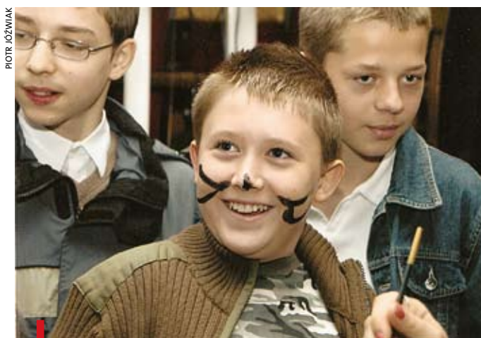
Otrzęsiny pierwszoklasistów roku 2007/2008 – „kotki” świetnie się bawiły

w gimnazjum jest niebywale trudny dla młodych ludzi, a jeszcze trudniejszy dla ich rodziców. Trzy lata gimnazjalisty to okres, gdy intensywny wzrost i dojrzewanie biologiczne nastolatków nakłada się na szybki rozwój intelektualny i emocjonalny. W tym czasie przewartościowują się kryteria wyboru życiowych celów. Dlatego, jako nauczyciele, włączamy się w pomoc rodzinie. Chcąc ją wspierać, stajemy się po trosze przedłużeniem ramienia rodziców, uzupełniamy się wzajemnie. Jak dla nich, tak i dla nas główną troską jest młody człowiek i jego dobro. Staramy się, aby nie pozostał sam w sytuacjach skrajnych, żeby otwierał się na świat, jeśli wzrastał zamknięty na niego, i znał swoje granice, gdy wcześniej ich nie było. Unikamy ścigania się i niezdrowej rywalizacji. Chcemy pomóc odkryć i ukształtować w dziecku to, co w nim najlepsze. Wychowując według wartości katolickich, jednocześnie kształcimy z wykorzystaniem nowoczesnych technologii. Cenimy indywidualność każdego ucznia, a gdy pojawiają się trudne problemy wieku młodzieńczego, staramy się postrzegać je jednostkowo i pomagać w ich rozwiązaniu.