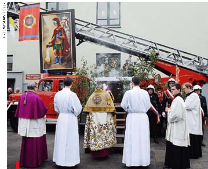
Przybrany zielenią pojazd, z uniesioną drabiną i wizerunkiem św. Floriana, przygotowali wrocławscy strażacy