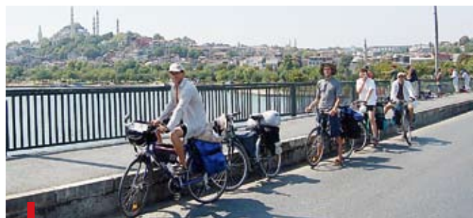
Na rowerowym szlaku