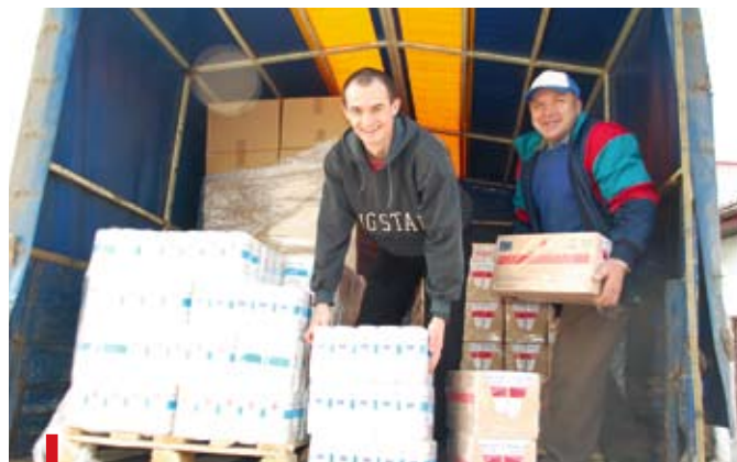
Kończy się rozładunek żywności z seminaryjnego MAN-a

Dzięki ich działalności w ubiegłym roku kilkunastu studentów otrzymywało comiesięczne stypendia finansowe. Wtedy też w współpracy z diecezjalną Caritas i Radomskim Bankiem Żywności rozpoczęto akcję rozdawania żywności. W 2007 roku z tej po-