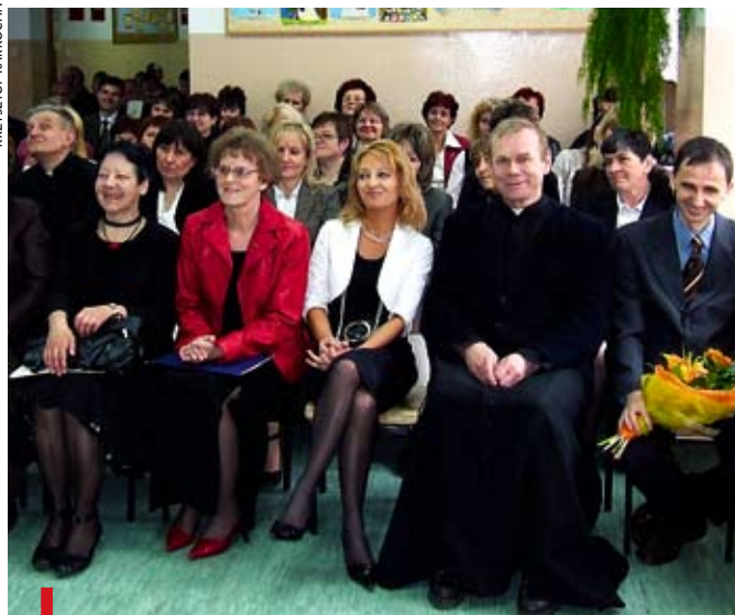
Po Mszy św. uczestnicy Forum Wychowawczego KSW spotkali się w SP nr 2