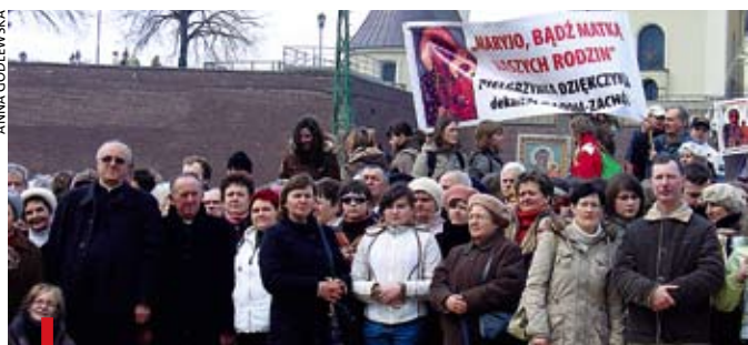
Pielgrzymi pod jasnogórskimi wałami