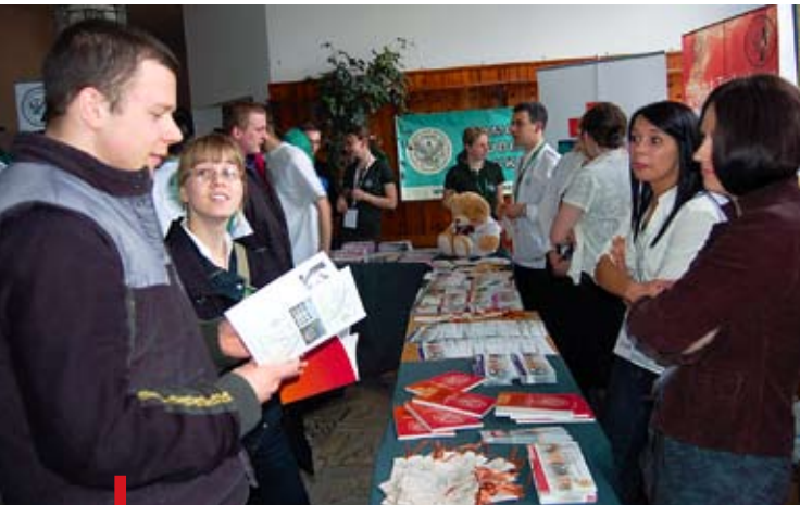
Foldery i ulotki to cenne zdobycze, które można zabrać do domu i tam uważnie przeczytać