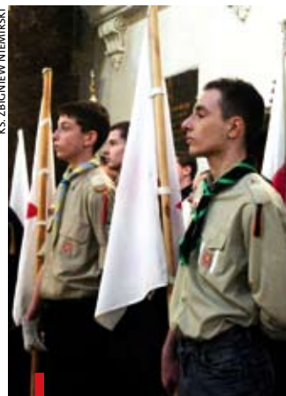
Harcerska Msza św. u Matki Bożej Pocieszenia w Błotnicy