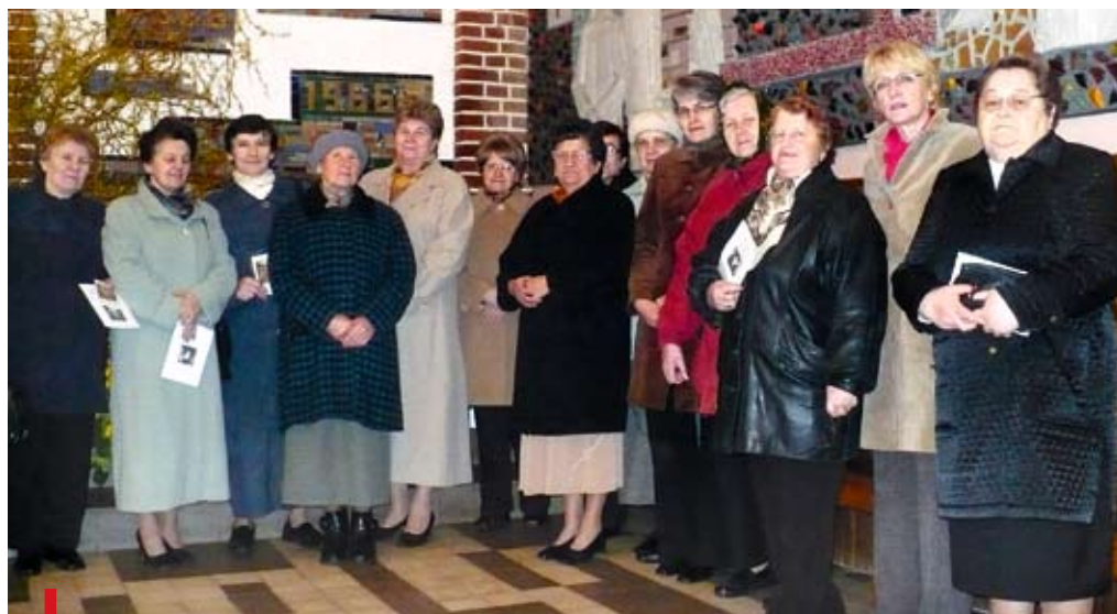
Członkinie kół Żywego Różańca ze Świerż Górnych

W parafii o historii liczącej niemal 900 lat dokonały się wielkie zmiany.