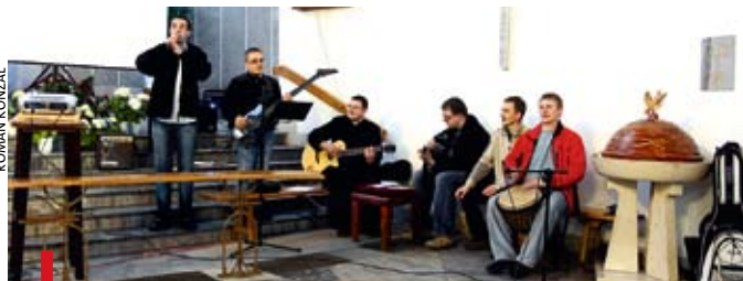
Koncert kleryckiego zespołu w kościele w Zabrze Helence

DIECEZJA. Z okazji Świątowego Dnia Modlitw o Powołania 13 kwietnia klerycy Wyższego Seminarium Duchownego w Opolu odwiedzili aż 18 parafii w diecezji gliwickiej. Już w piątek 11 kwietnia na spotkaniu z młodzieżą w parafii Najświętszej Maryi Panny Matki Kościoła w Zabrze Helence zagrał klerycki zespół muzyczny. W innych parafiach po dwóch, trzech alumnów służyło podczas