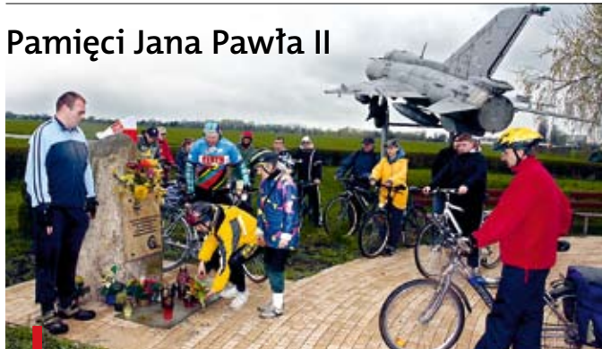
Rowerzyści złożyli kwiaty przed obeliskiem upamiętniającym wizytę Papieża

GLIWICE. W sobotę 12 kwietnia odbył się II Gliwicki Rajd Rowerowy im. Jana Pawła II. Jego inicjatorem jest Magazyn Turystyczno-Sportowo-Trampingowy „Cykloturysta”. Pomimo deszczowej pogody 14 rowerzystów wystartowało spod katedry na Lotnisko Aeroklubu Gliwickiego. Przed obeliskiem upamiętniającym wizytę Jana Pawła II złożono kwiaty i odmówiono modlitwę w intencji rychłej