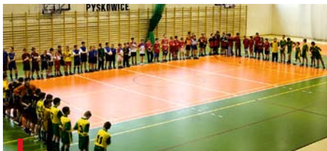
Ministranckie zespoły w trakcie otwarcia turnieju

PYSKOWICE. W decydującą fazę wkraczają piłkarskie mistrzostwa ministrantów diecezji gliwickiej. Po dekanalnych rozgrywkach przyszedł czas na walkę w półfinałowych turniejach diecezjalnych. W pierwszym z nich rywalizowali ministranci ze szkół podstawowych. Awans do zawodów finałowych wywalczyły parafie: Ducha Świętego w Gliwicach-Ostropie, NMP Królowej Różańca Świętego w Boronowie, Wszystkich Świętych w Bojszowie i św. Marcina w Starych Tarnowicach. W kolejnych półfinałowych zawodach (26 kwietnia i 17 maja), które odbędą się także w Pyskowicach, o awans