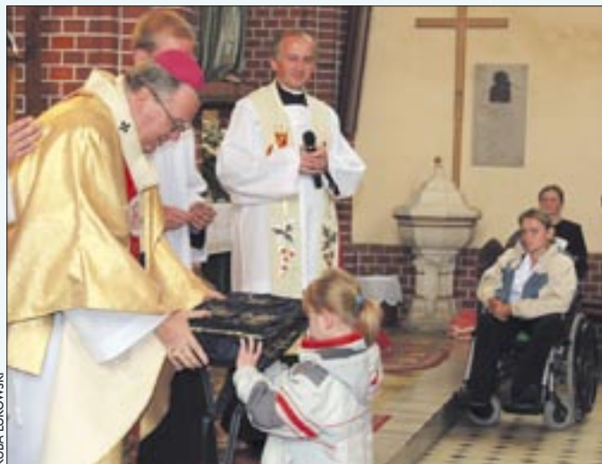
Podczas Mszy św. u progu roku szkolnego w procesji z darami do ołtarza przyniesiono m.in. szkolny plecak