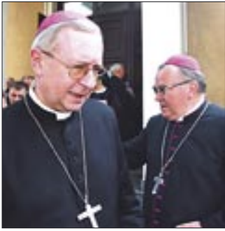
Abp Stanisław Gądecki z Poznania (z lewej) z abp. Marianem Gołębiewskim