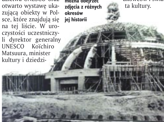
REPRODUKUCJA AGATA COMBIK