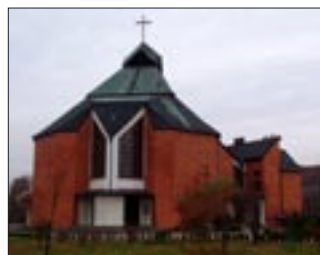
Kościół pw. św. Andrzeja Apostoła we Wrocławiu Stabłowicach (program obchodów na s. VII)