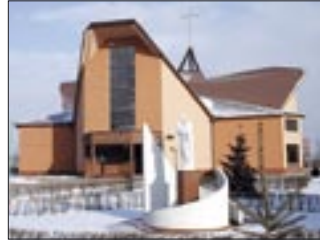
Kościół pw. Miłosierdzia Bożego w Olawie