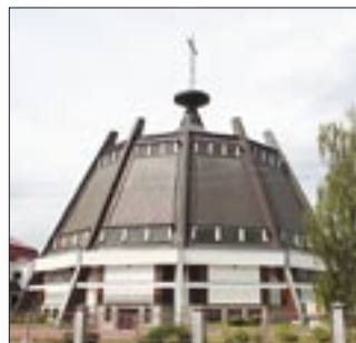
Kościół pw. św. Franciszka z Asyżu