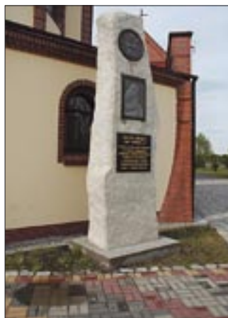
Kościół pw. św. Maksymiliana Kolbego we Wrocławiu