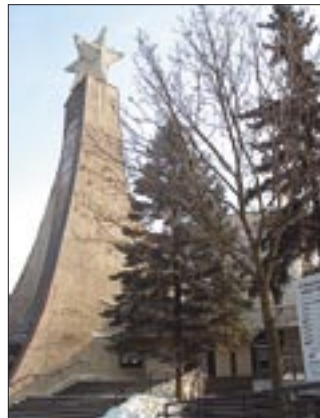
Kościół pw. św. Wawrzyńca przy ul. Bujwida we Wrocławiu

Msza św. jubileuszowa zostanie odprawiona 27 maja o godz. 10.00.