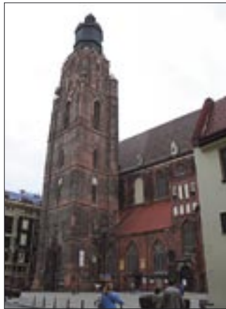
Kościół garnizonowy pw. św. Elżbiety we Wrocławiu (program obchodów 10-lecia na s. VII)

W czasie trwania 46. MKE (25.05–1.06. 1997) w naszej diecezji zostało poświęconych bądź konsekrowanych wiele nowych kościołów. W tym roku świętujemy w nich uroczyste 10. rocznice tamtych wydarzeń.