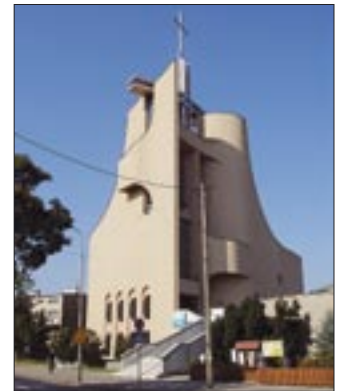
Kościół pw. Trójcy Świętej we Wrocławiu

Jubileuszowe obchody otworzy Triduum, które zacznie się 27 maja na Mszy św. o godz. 18.30. Uroczystej Eucharystii 28 maja będzie przewodniczył abp Marian Gołębiewski.