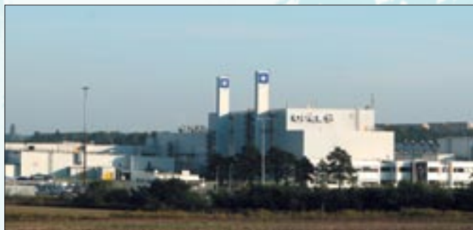
Każdego roku gliwicką fabrykę Opla opuszcza ponad 100 tys. samochodów

GLIWICE. W marcu rozpoczęły się negocjacje z fabrykami, które zamierzają rozpocząć produkcję nowego modelu Astry. O prestiżowe zlecenie ubiegają się fabryka Opla w Gliwicach oraz zakłady z Wielkiej Brytanii, Belgii i Szwecji. Decyzja, gdzie będzie produkowana nowa Astra, zapadnie latem br. W ocenie specjalistów fabryka w Gliwicach ma duże szan-