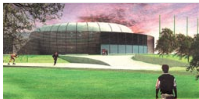
WIZUALIZACJA UM GLIWICE

„Podium” ma stanąć w miejscu zdevastowanego stadionu XX-lecia. Władze Gliwic uważają, że powinien to być wielofunkcyjny obiekt, służący organizowaniu imprez widowiskowych, sportowych, kulturalnych, wystawienniczych i targowych. Ma spełniać standardy wymagane przy organizacji mistrzostw Europy czy świata. Obiekt ma mieć widownię na 15 tys. osób. W zależności od potrzeb można by w nim ustawić estradę albo urządzenia pozwalające rozgrywać zawody sportowe. W obiekcie przewidziano również powstanie mniejszej hali z widownią na 1000 osób.