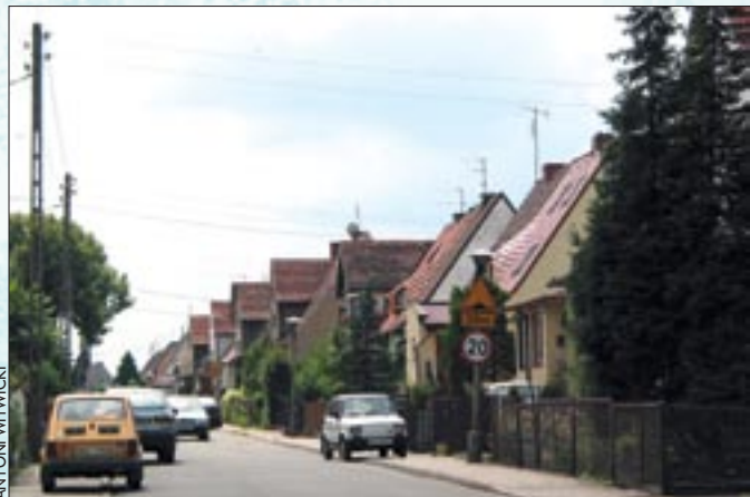
Unijnych pieniędzy Śląsk dostał i tak najmniej. Na modernizację wielu miejscowości przyjdzie jeszcze długo czekać