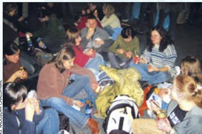
Studenci z DA RESURREXIT w Zagrzebiu