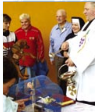
Błogosławieństwo zwierząt w parafii św. Jacka

SOŚNICA. Kilkadziesiąt kudłatych pupili przynieśli ze sobą mieszkańcy Sośnicy na błogosławieństwo zwierząt. Tradycyjnie we wspomnienie św. Franciszka w muszli koncertowej przy kościele św. Jacka odbyło się niezwykle nabożeństwo. Podobnie jak w poprzednich latach najczęściej było psów, ale nie zabrakło także kotów, gryzoni czy ptaszków. Błogosławieństwo zwierząt odbyło się także w gliwickiej parafii Podwyższenia Krzyża Świętego.