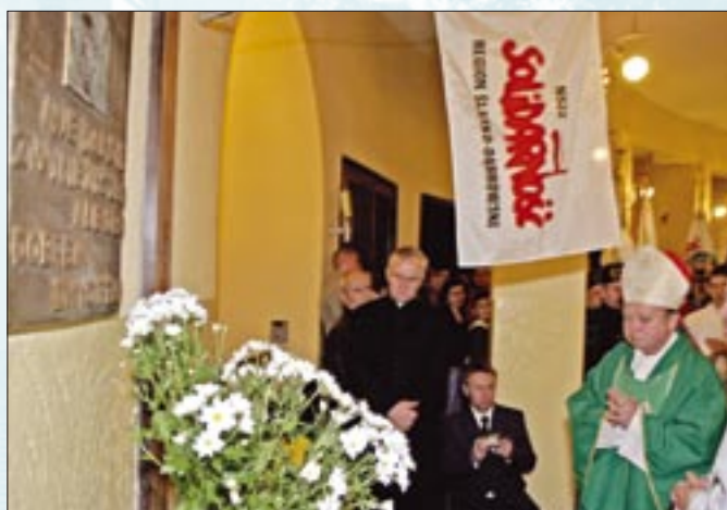
Jak co roku złożono kwiaty po tablicą poświęconą ks. Popiełuszce