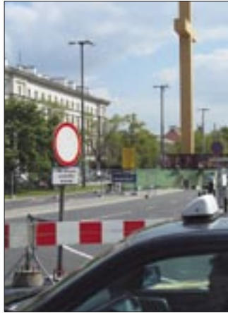
W czasie papieskiej pielgrzymki okolice placu Piłsudskiego będą nieprzejezdne

Od 22 maja na trasie, którą będzie poruszał się Ojciec Święty, będzie obowiązywał zakaz zatrzymywania się (także na ulicach poprzecznych, na długości 50 m od trasy przejazdu). 24 maja przez cały dzień z ruchu będą wyłączone pl. Piłsudskiego, ul. Królewska i al. Szucha. 25 maja komunikacja miejska będzie kursowała jak co dzień. Jednak od godz. 8.00 do godz. 16.00 dnia następnego będzie wyłączony z ruchu Trakt Królewski (na odcinku Spacerowa–Świętojerska). W czwartek od godz. 8.00 do 12.30 nie będzie też można przejechać ulicami: Traktem Królewskim (od Spacerowej do Muranowskiej), Świętojerską, Anielewicz, Zamenhofa, Lewartowskiego, Stawki, Muranowską oraz Zwirki i Wigury. Od godz. 11.00 zamknięte dodatkowo będą: Trasa Łazienkowska (od Grójeckiej do Włostrodzkiej) oraz ulice poprzeczne do wyżej wymienionych. 25 maja w godz. 14.00–15.00, 17.00–17.30 i 19.00–20.00, a także w piątek w godz. 8.00–9.00 nie będzie można wjechać w ulice poprzeczne do Traktu Królewskiego (Trasa Łazienkowska, Piękna, Al. Jerozolimskie, Świętokrzyska, al. Solidarności). W piątek od godz. 10.30 do ok. 14.00 wyłączone będą z ruchu ul. Marszał-