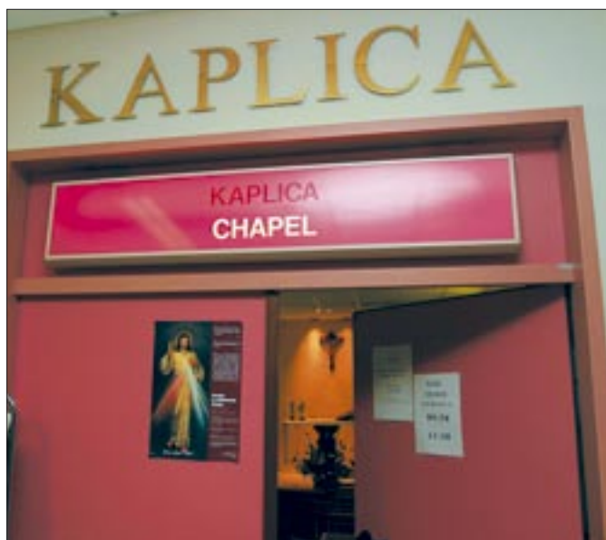
W tej kaplicy w hali odlotów modlili się „wielcy tego świata” – m.in. przyszły papież Benedykt XVI