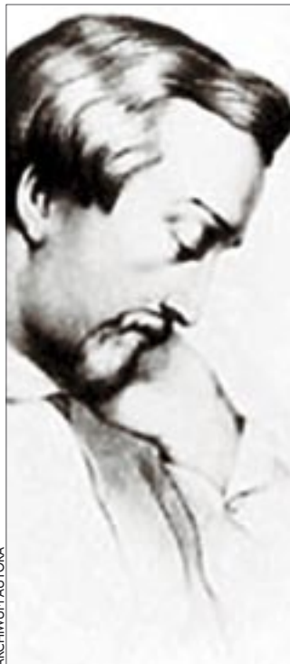
Heinrich Heine w Paryżu

Heinrich Heine urodził się w rodzinie kupca żydowskiego w roku 1797 w Düsseldorfie