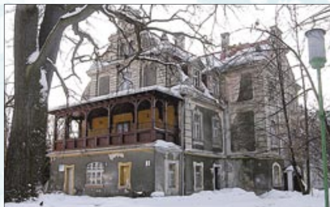
Dzięki remontowi poprawiły się warunki pobytu pacjentów

mężczyzn, jednak prawdopodobnie w niedalekiej przyszłości z pomocy specjalistów będą mogły korzystać również kobiety. Dzięki remontowi oddział będzie w stanie przyjąć większą liczbę pacjentów. Do ich użytku oddano dziewiętnaście przytulnych 2- i 3-osobowych pokoi. Utworzono trzy nowe sale do pracy z pacjentami oraz gabinety do pracy indywidualnej. Znacznie poprawiły się warunki pracy terapeutów oraz komfort pobytu pacjentów.