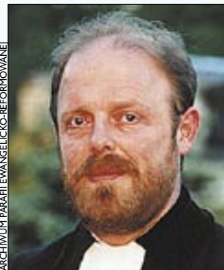
ARCHIMUNI PARAFII EWANGELICKO-REFORMOWANEJ