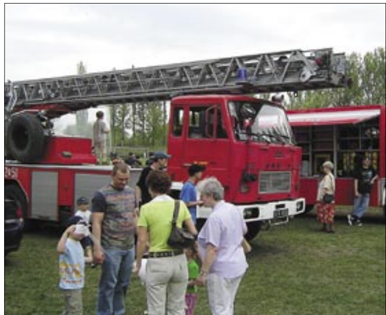
W akcjach używa się dziś specjalistycznych wozów. Niestety, dla większości strażackich jednostek takie pojazdy to tylko marzenie

O swoim znaczeniu ochotnicy przekonywali już wielo-