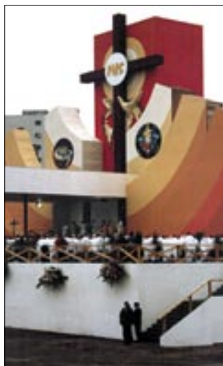
Óltarz przygotowany na Statio Orbis