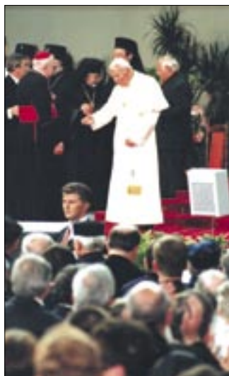
Jan Paweł II z kard. H. Gulbinowiczem przed modlitwą ekumeniczną