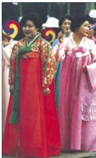
Na 46. MKE przyjechali chrześcijanie różnych kultur