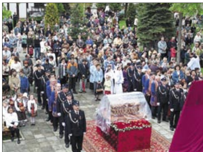
Msza św. przy ołtarzu połowym bazyliki Matki Bożej Bolesnej. Limanowa, 16 maja