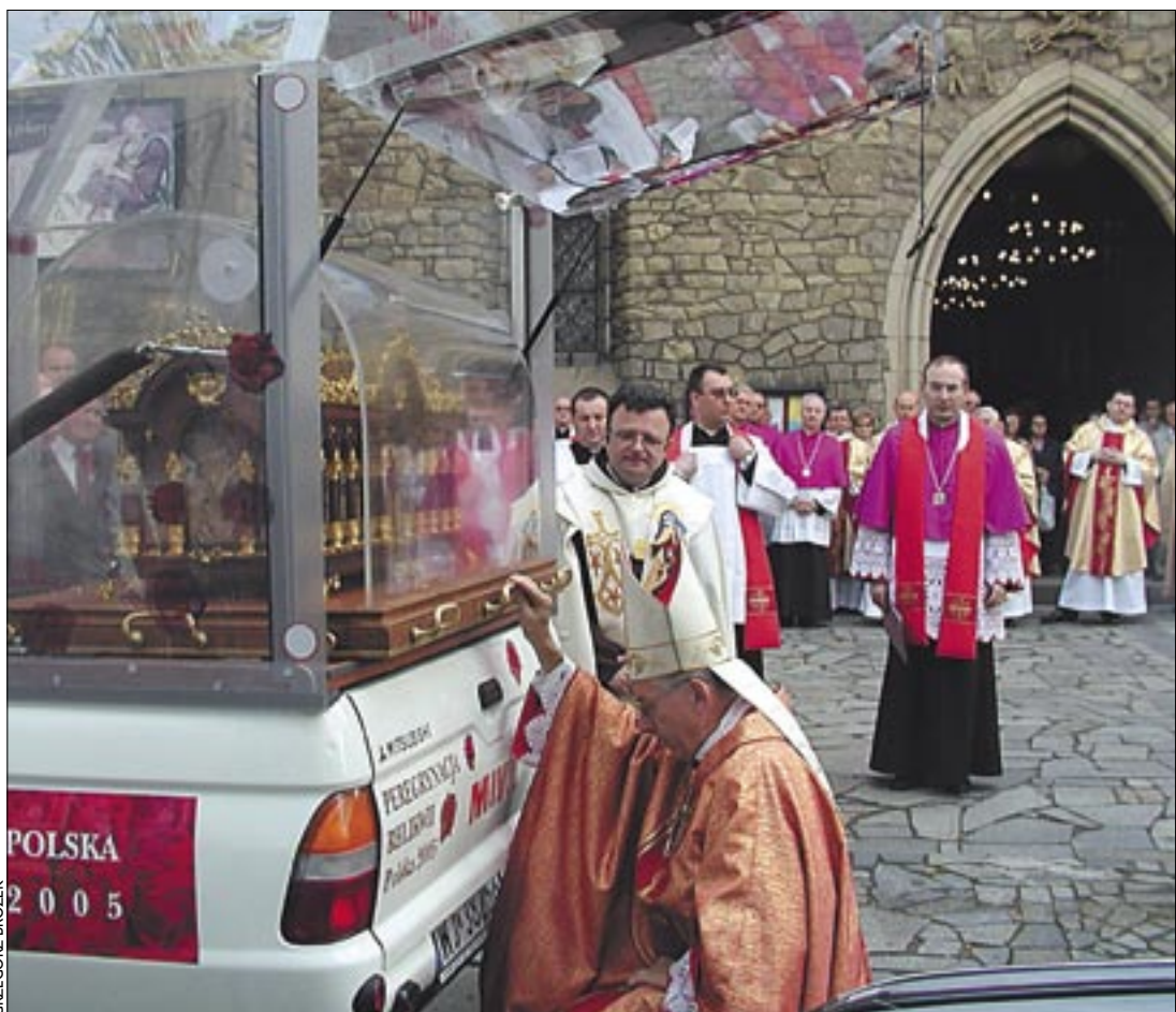
Obok: Powitanie relikwii przez Pasterza Kościoła tarnowskiego. Nowy Sącz, 15 maja