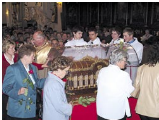
Modlitwa przy relikwiarzu w bazylice Świętego Mikołaja. Bochnia, 17 maja