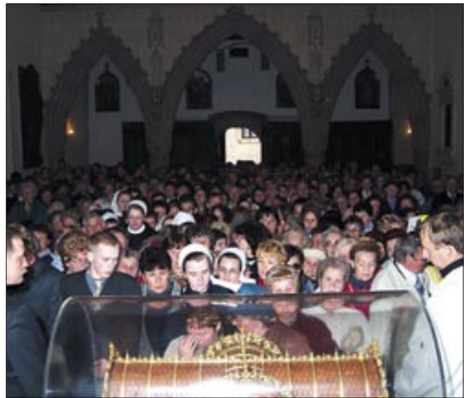
Oddanie czci św. Teresce w bazylice katedralnej. Tarnów, 19 maja