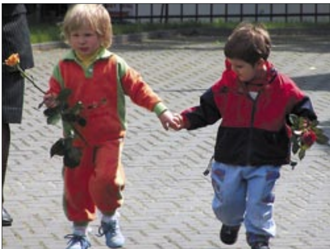
Z dziecięcą ufnością do św. Teresy przybywali młodzi i starsi. Bochnia, 17 maja