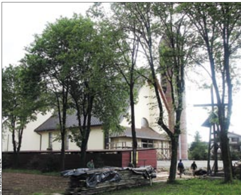
KS. ANDRZEJ TUREK

Po pożarze w za- bytkowym osiemnasto- wiecznym kościele nie dało się już sprawować kultu. Świątynia „po przejściach” odeszła na zasłużoną emerytu- rę do sądeckiego skan- senu. A wierni zostali praktycznie bez kościo-