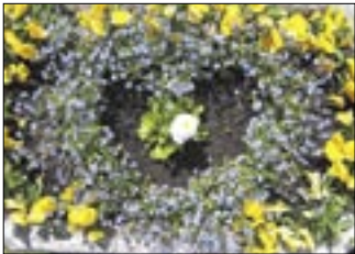
Dla człowieka o wielkim sercu bocheńskie dzieci ofiarowały małe, ale wymowne serce

Żywy pomnik dla Papieża Polaka „postawili” Młodzi Ekolodzy z Bochni. Serce z niezapominajek ze stokrotką w środku ułożone zostało przy bazylice św. Mikołaja w Bochni. W akcję włączyła się młodzież z Gimnazjum nr 1 w Bochni oraz z Zespołu Szkół w Nieszkwowicach Wielkich. Sadzeniu niezapominajek towarzy-