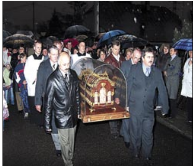
Procesja do domu Sióstr Terezanek. Tarnowiec, 18 maja

Zakończenie peregrynacji relikwii w diecezji tarnowskiej nastąpiło 20 maja. W Pilźnie, o godz. 8.00, odbyło się uroczyste przekazanie relikwiarza do diecezji rzeszowskiej.