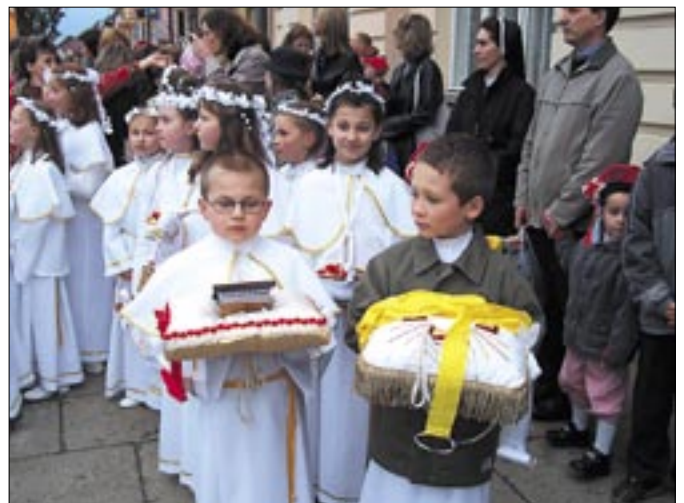
Ostatni przystanek relikwii, które nazajutrz wyruszyły do diecezji rzeszowskiej. Pilzno, 19 maja