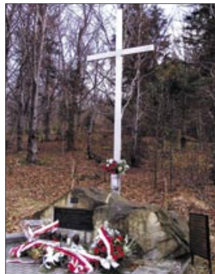
W Bielsku-Białej uczczono 65. rocznicę zbrodni katyńskiej (na zdjęciu u góry). Krzyż na Przegibku upamiętnia poległych i zmarłych inwalidów wojennych (powyżej).

Członkowie bielskiego Stowarzyszenia „Rodzina Katyńska” zadbali, by uczczona została pamięć dwudziestu dwóch tysięcy polskich oficerów, zamordowanych 65 lat temu w Katyniu, Miednoje, Charkowie i w wielu innych, często do dziś nieznanach miejscach kaźni na Nieludzkiej Ziemi, którą Ojciec Święty Jan Paweł II nazwał „Golgota Wschodu”. Msza św. w ich intencji odprawiona została w niedzielę, 24 kwietnia, w bialskim kościele pw. Opatrzności Bożej. Przewodniczył jej