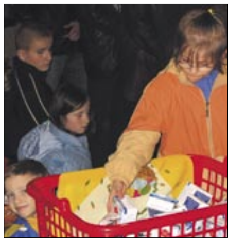
Dzięki skarbonkom rozwijają się serca