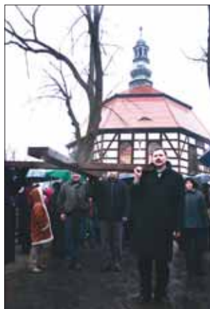
Podczas Drogi Krzyżowej drugi, większy, krzyż nieśli parafianie. Przy każdej kolejnej stacji przejmowali go wierni z innej miejscowości.