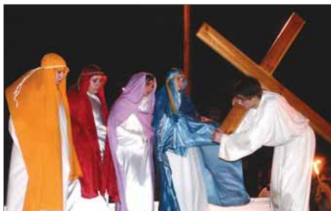
Przy kolejnych stacjach do spektaklu włączali się kolejni członkowie duszpasterstw młodzieżowych z Sułowa i okolic

Orszak poprzedzają trzy samochody. Radiowóz, bus z nagłośnieniem, i auto-scena, na której młodzi aktorzy, przy kolejnych stacjach, odgrywają pantomimiczne sceny odtwarzające fabułę.