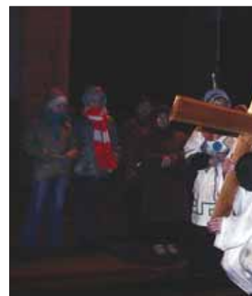
Trzeci upadek pod krzyżem, był, jak zazna Proboszcz, najcięższy. Odgrywający postać asfalt. Przy tej stacji zrezygnowano z „sar