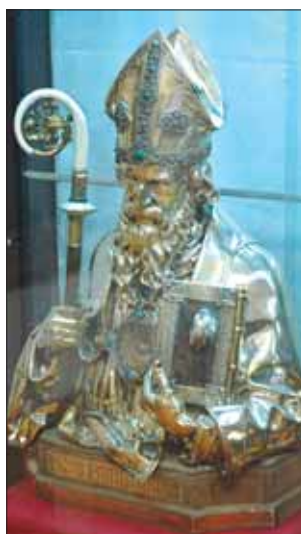
Zabytkowy relikwiarz św. Bonifacego

Od połowy marca we wrocławskim Muzeum Archidiecezjalnym można zwiedzać dwie nowe sale wystawowe.