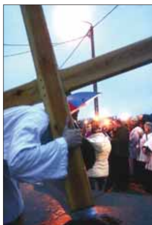
Pierwszy upadek pod krzyżem – młodzi aktorzy dla lepszej widoczności odgrywali stacje na lawecie samochodu