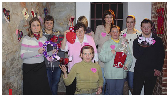
Prace zachwycają pomysłowością i różnorodnością. Do 15 lutego można je podziwiać w zabrzańskiej Galerii „Piwnica rysia”