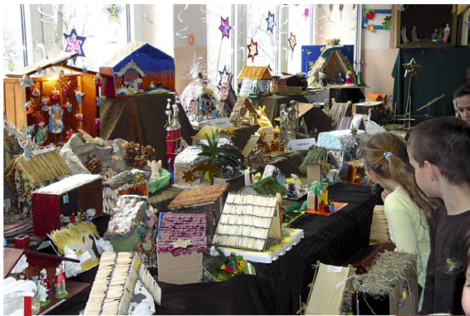
Na konkurs przysłano szopki wykonane z różnych materiałów, a nawet z... makaronu