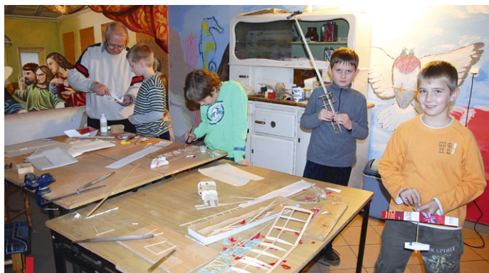
W Piwnicy funkcjonuje m.in. pracownia modelarska