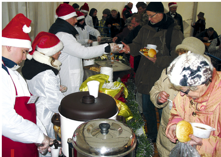
Już po raz ósmy mieszkańcy stolicy spotkali się na miejskiej wigili na pl. Teatralnym