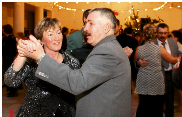
Sylwestrowe zabawy odbędą się też w parafialnych salach

A dlaczego by Nowego Roku nie powitać na wspólnej zabawie w parafii? Na przykład w domu parafialnym przy kościele św. Wincentego