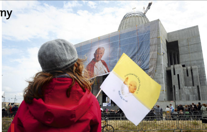
Na frontonie Świątyni Opatrzności Bożej w Wilanowie zawisł największy i nietypowy portret beatyfikacyjny Jana Pawła II

Czuwanie na pl. Piłsudskiego, Msze św., modlitwy, koncerty, wystawy, miasteczko papieskie w Wilanowie oraz odsłonięcie na frontonie Świątyni Opatrzności Bożej wielkiego obrazu beatyfikacyjnego Jana Pawła II, złożonego ze 105 tys. zdjęć nadesłanych przez Polaków – tak Warszawa cieszyła się 1 maja z beatyfikacji Jana Pawła II. Miesiąc później, w Dniu Dziękczynienia, do Świątyni Opatrzności przeszedł marsz ubranych na biało warszawiaków, którzy nieśli z pl. Piłsudskiego relikwiarz z fragmentem skrwawionej sutanny bł. Jana Pawła II. Relikwiarz został złożony w Panteonie Wielkich Polaków. W następnych miesiącach także inne warszawskie parafie otrzymały relikwie nowe-