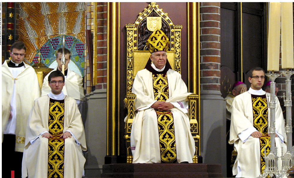
17 GRUDNIA, KATEDRA ŚW. FLORIANA NA PRADZE. Jubilat dziękuje Bogu za dar kapłaństwa