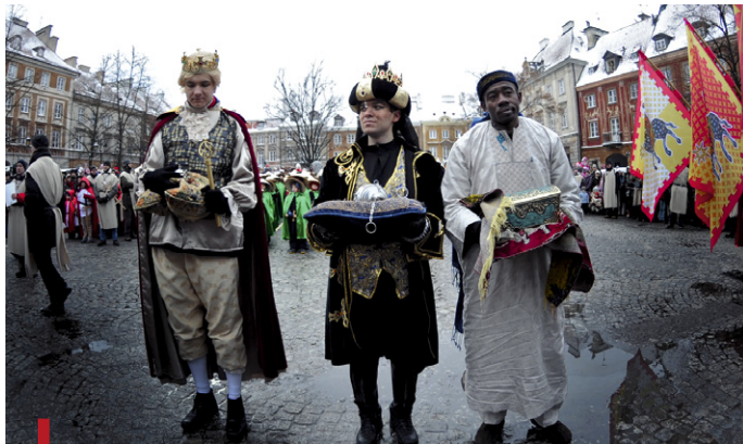
Już po raz czwarty warszawiacy będą mieli okazję podążać za Mędrcami ze Wschodu

Jest w Orszaku Trzech Króli obecna zarówno ewangelizacja miasta, świadectwo wierzących w miejscu publicznym oraz konkretna troska o kreowanie nowych zwyczajów religijnych – napisał kard. Kazimierz Nycz we wstępie do nowej edycji śpiewnika kolęd, z którym warszawiacy po raz czwarty wyruszą z pl. Zamkowego. W tym roku fundacja Orszaku Trzech Króli wydrukowała ich aż 60 tys.,