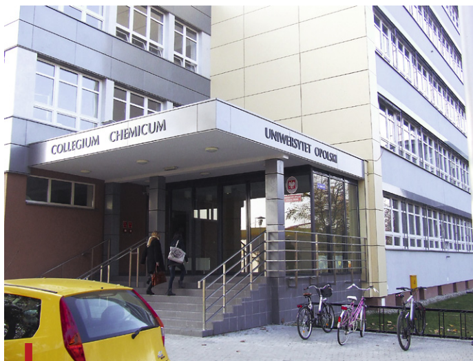
W rozbudowanym i zmodernizowanym budynku łatwiej będzie pokonywać trudy studiowania

remontowych i modernizacyjnych budynku Collegium Chemicum z całym jego wyposażeniem. Projekt przebudowy budynku Wydziału Chemii miał na celu przede wszystkim dostosowanie uczelni do wymogów i oczekiwań wobec tego typu jednostek dydaktyczno-badawczych, działających w europejskiej przestrzeni naukowej i dydaktycznej. Projekt sfinansowany w ramach Regionalnego Programu Operacyjnego Województwa Opolskiego uzyskał wsparcie Unii Europejskiej.