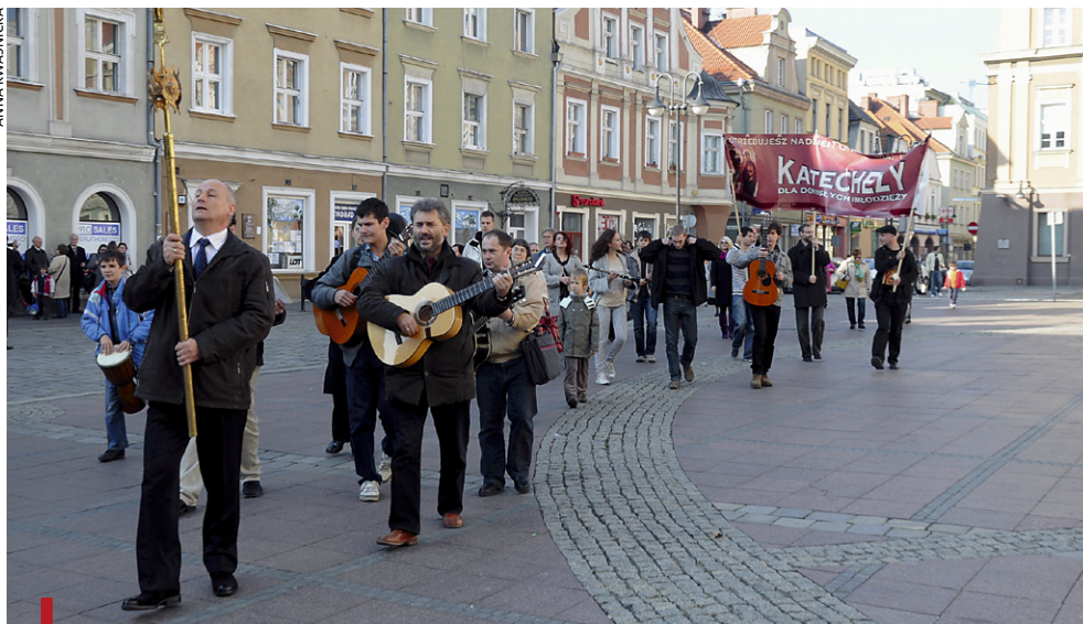
OPOLE, 6 LISTOPADA. Pokazali, że wiara nie jest sprawą prywatną, którą należałoby zamknąć w murach kościoła