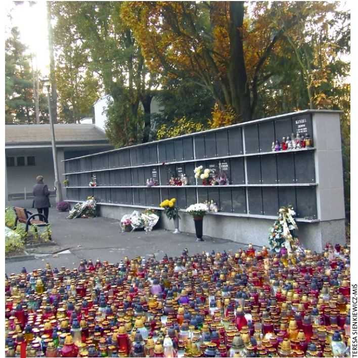
Kolumbarium na opolskim cmentarzu

OPOLE-PÓŁWISŁ. Pierwsze w Opolu kolumbarium wybudowane zostało w roku 2009 na komunalnym cmentarzu w Opolu-Półwsi. Usytuowano je w starej części cmentarza w pobliżu kaplicy. Jak informuje Julian Juszczeński, zastępca administratora komunalnych cmentarzy, zainteresowanie było na tyle duże, że należało zaplanować budowę następnego kolumbarium. Jego budowa zakończona została w bieżącym roku. Zarówno w jednym, jak i w drugim kolumbarium jest po 96 nisz, przy czym w każdej z nich można