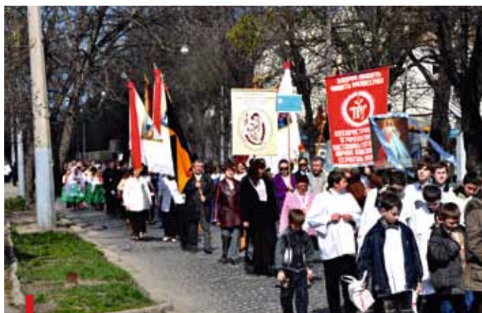
W procesji z relikwiami św. Bilczewskiego przez Lwów przeszło ponad 200 mieszkańców Wilamowic

że to jemu zawdzięczamy szczęśliwy i tak szybki postęp prac. Pod jego opiekę oddają też wszystkich, którzy przyczynili się do tego, że możliwe było ukończenie budowy ochronki. Będzie ona służyła następnym pokoleniom parafian i mieszkańcom całej gminy, przygotowując dzieci do życia. Ufam, że taka forma naszej wdzięczności