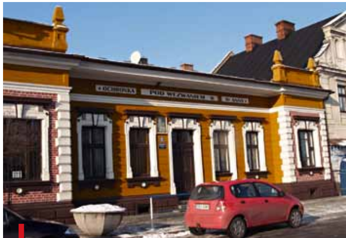
Ochronka św. Anny ufundowana w Wilamowicach przez abp. Bilczewskiego

– Codziennie polecam opiekę i wstawianictwo św. Bilczewskiego tę budowę. Jestem przekonany,