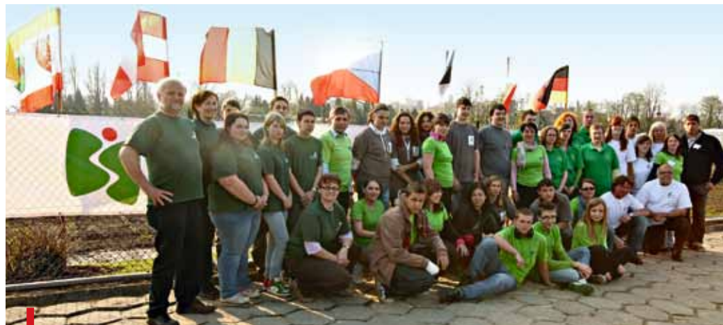
Narodowe ogrody wykonali młodzi ogrodnicy z sześciu krajów

Jubileuszowy, trzydziesty rajd zakończy się na Groniu Mszą św. sprawowaną 12 czerwca o 12.00 przez ks. prał. Krzysztofa Ryszkę. Szczegółowy opis szlaków na Groniu można znaleźć na www.gron.diecezja.bielsko.pl .