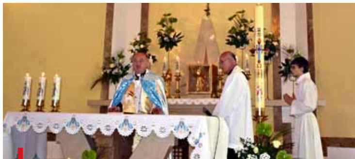
Kard. Kazimierz Nycz zachęcał do naśladowania nowego błogosławionego

Uroczystość poświęcenia wizerunku bł. Jana Pawła II, znajdującego się w głównym ołtarzu filialnego kościoła w Iłownicy, poprzedziła zaplanowaną na 29 czerwca konsekrację tej świątyni. Poświęcenia dokonał kard. Kazimierz Nycz.