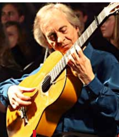
Wirtuoz gitary Paco Peña i jego zespół nie zawiedli bielskich miłośników flamenco