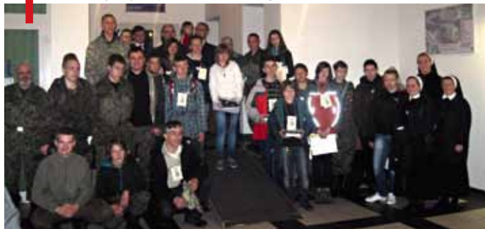
Uczestnicy rajdu po wręczeniu nagród

ściach upamiętniających obchody 3 maja z 1946 r. Wtedy żołnierze Narodowych Sił Zbrojnych ze zgrupowania kapitana Henryka Flamego zajęli Wisłę i przeprowadzili w niej defiladę pododdziałów. Uczestnicy rajdu zmierzli się też w konkursie wiedzy historycznej oraz w zawodach strzeleckich. np