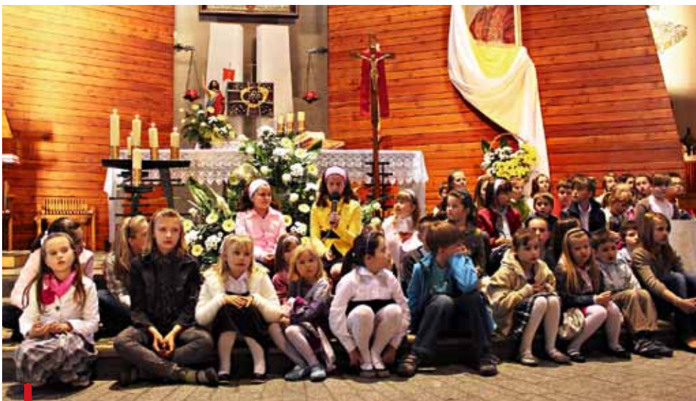
PISARZOWICE, 6 MAJA 2011 R. Najmłodsi parafianie zaprosili do dziękczynienia za beatyfikację Jana Pawła II. Za nimi – tabernakulum podarowane przez kard. Wojtyłę