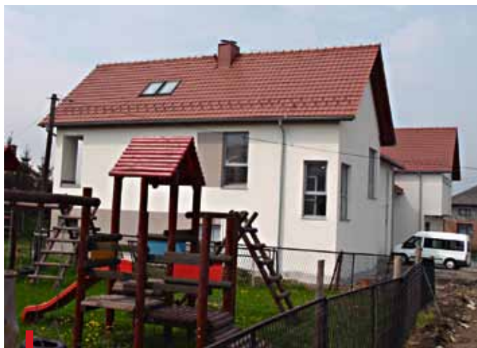
Budynek nowej ochronki jest już prawie gotowy