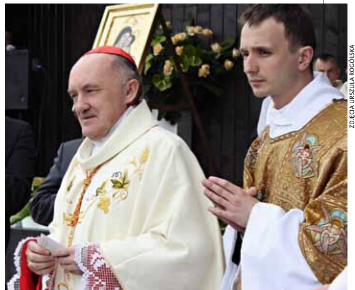
Kardynał Kazimierz Nycz po raz pierwszy oficjalnie przybył 7 maja do swojej Starej Wsi

na królewskim szlaku kardynała, z Warszawy do Krakowa, gdzie 8 maja na Skałce miał uczestniczyć w uroczystościach ku czci św. Stanisława. Przybył w rodzinne strony niby zwyczajnie, a jednak inaczej – wracał tu wcześniej jako kleryk, kapłan, biskup, ale tym razem, po raz pierwszy, oficjalnie jako kardynał.