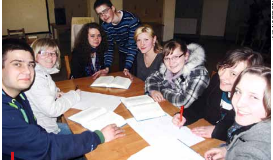
Młodzi uczyli się, jak interpretować Pismo Święte

W programie trzydniowego spotkania w Radomiu znalazły się konferencje, udział w nabożeństwach, modlitwa, ale i czas na inte-