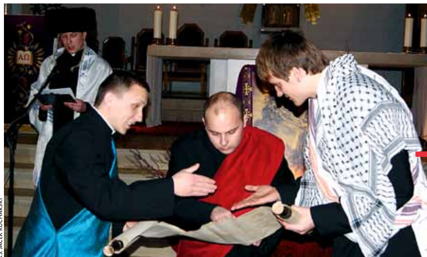
Scenariusz przedstawienia powstał na podstawie książki ks. Andrzeja Bosowskiego