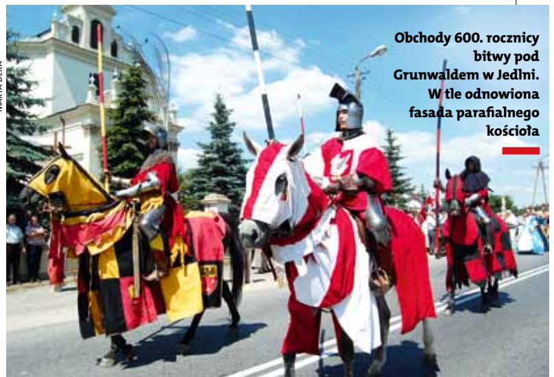
Obchody 600. rocznicy bitwy pod Grunwaldem w Jedlni. W tle odnowiona fasada parafialnego kościoła