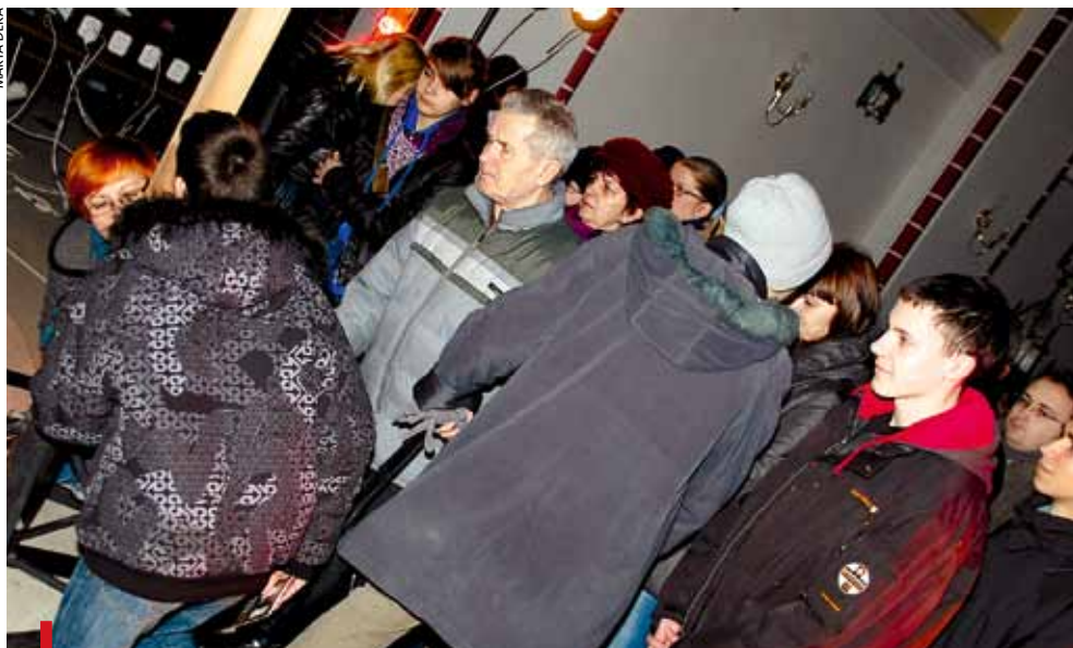
Każdą Drogę Krzyżową kończy ucałowanie krzyża